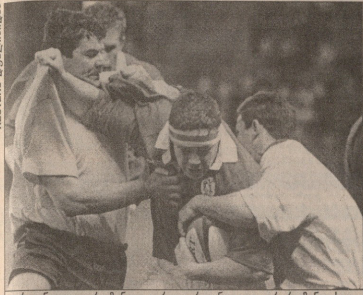
ირლანდია — რუმინეთი. ერთი ირლანდიელი ორ რუმინელსაც იოლად უშეცვლადებოდა