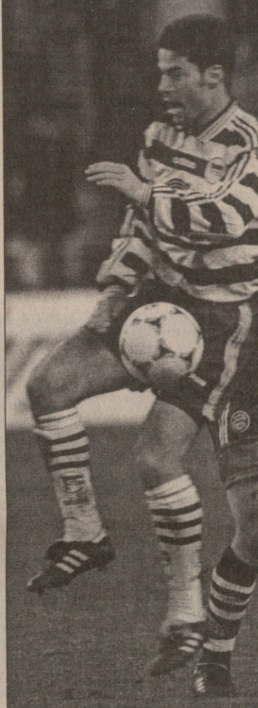
პრეტა — ბაიერნი. ბერლინელებმა მიუნხენელებს სეზონში მეთრე მარცხი ატყეს

თამაშის შემდეგ „ლაუტერნი“ ოტო რეპაგელს შეგიძლიათსათვის საქებარი სიტყვები არ დაუშურებია: „90 წუთი ვიბრძოლეთ და მოგება დავიმსახურეთ. მეტოქეც კარგად გამოიყვანა, მაგრამ ჩემი ბიჭები დღეს შეუდარებელი იყვნენ, მა-