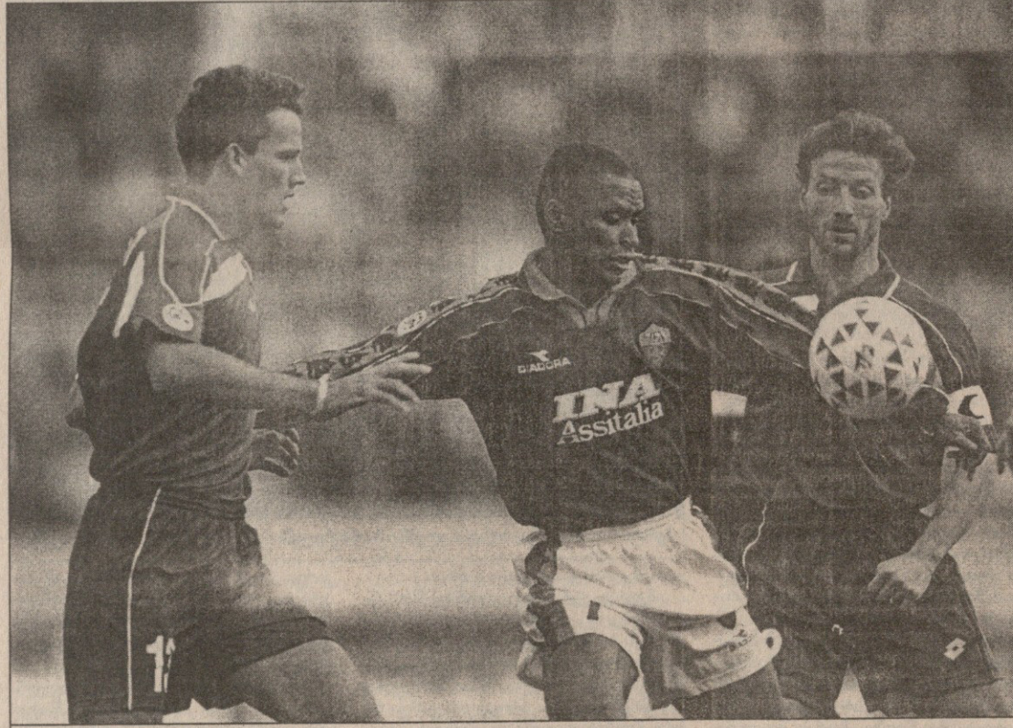
რომა — ბარი. რომელიც ალდარი ინოკენტისა და გარსიას შორის

— დიან, ბოლო ორი-სამი წლის განმავლობაში ფეხბურთისთვის მართლაც მნიშვნელოვანი კაცი გახლდით. ამიტომ