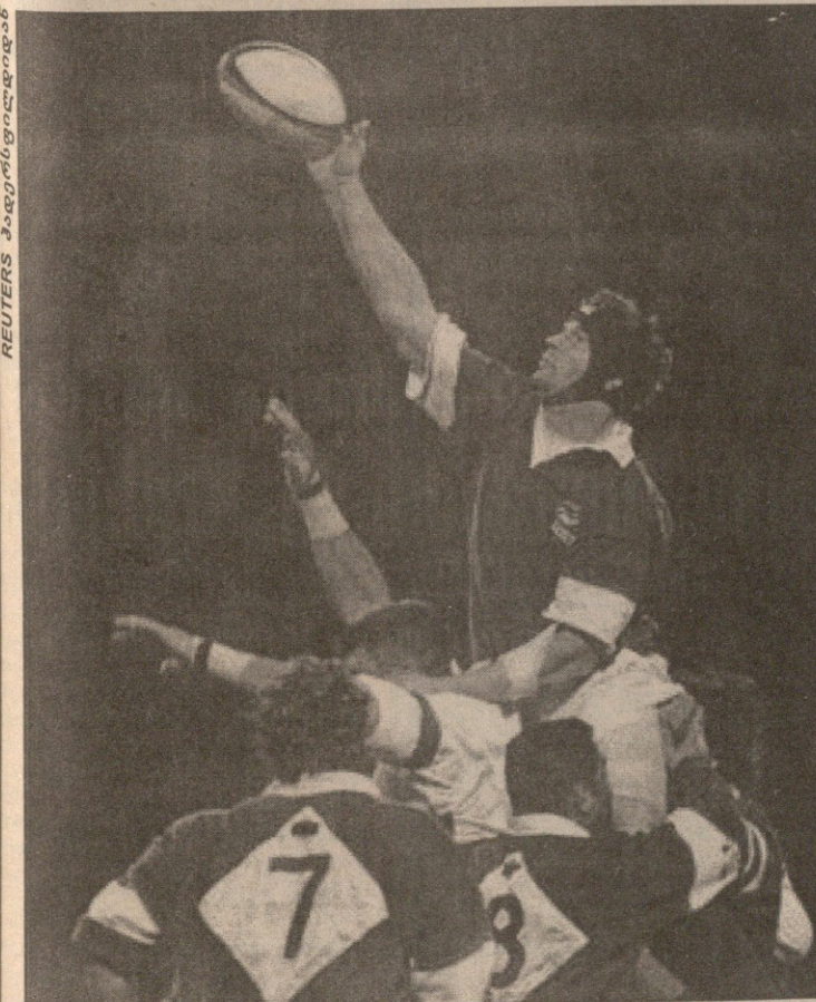
ინგლისი — იტალია. აპენინელებმა ბრიტანელებს ტოლი არაფერში დაუდეს, დერეფანშიც არაერთხელ აჯობეს

ირლანდიელებმა კარგად იცოდნენ, რუმინელებს რაც უნდა გულიანად ეთამაშათ, მათ მინც ვერ დაამარცხებდნენ. ამიტომაც, შეიძლება ითქვას, ირლანდიამ სამხრეთ აფრიკასთან მომავალი ტესტისთვის ერთგვარად წაივარჯიშა. პირველ ნახევარში კუნძულებს თავი არ გამოუღიადო. ნელა ბურთობდნენ, ხშირადაც ცდებოდნენ, თუმცა მეტოქეს დაწინაურებას არ ანებებდნენ. რუმინეთსაც მეტოქის უდარდლობით ისარგებლა და მესვენებამდე ორი ლელოც გაიტანა. პირველი ნახევარი სამყურებმა 19:13 მოიგეს. მეორე ნახევრის დასაწყისი პირველის მსგავსი გამოდგა — რუმინეთი აქტიურობდა, ირლანდია ნაკლებად, მაგრამ ამჯერად ირლანდიელთა „სიზარმაცემ“ დიდხანს არ გასტანა. მეორე ნახევრის შუაში მსაჯმა პოლ