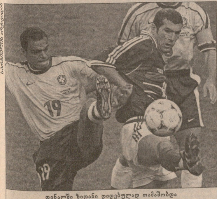
ფინალში ზიდანი დიდებულად თამაშობდა