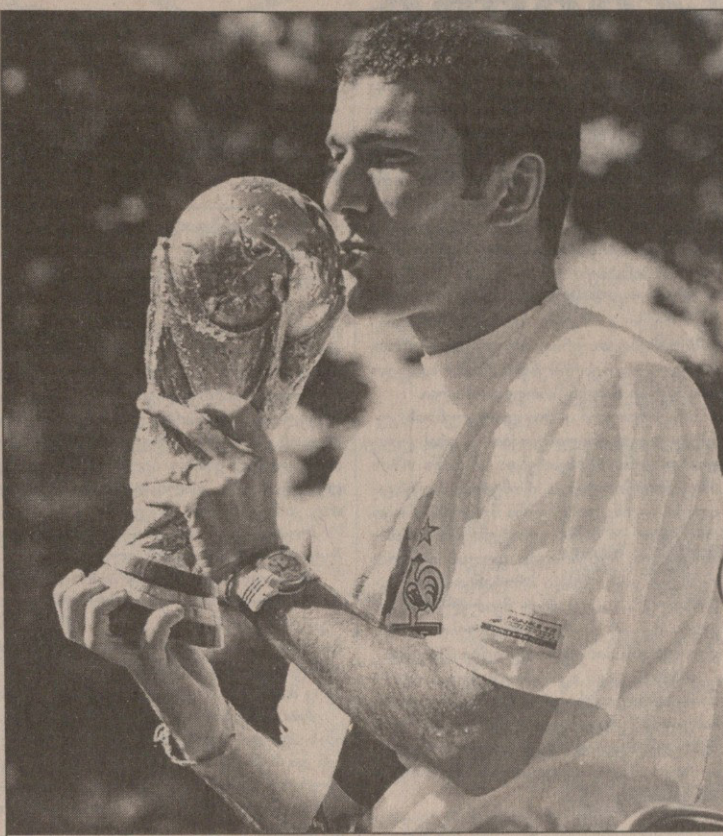
ზინედინ ზიდანის ოცნება ასრულდა

— მზად ვარ. მინდა, რაც შეიძლება მეტი ჯილდო და თასი მოვიგო, რადგან ის გრძობა, რაც ოქროს თასის აღმართვისას დამეფულა, არასდროს დამავიწყდება. მსოფლიოს ჩემპიონატმა გამარჯვების სურვილი გამძლია. ჩემი დიდი სურვილია, ზედიზედ მესამედ გავხდე იტალიის ჩემპიონი, თუმცა ვიცი, რომ ეს ურთულესი რამაა. არც ჩემპიონთა თასზე ვიტყვი უარს. ვეცდები, კლუბს ყველანაირად შევუწყო ხელი. მე მართლაც მზად ვარ.