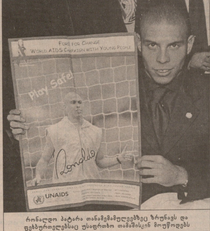
რონალდო პატარა თანამემამულეებზეც ზრუნავს და ფეხბურთელებსაც უსაფრთხო თამაშისკენ მოუწოდებს

რონალდომ ამას წინათ რომი რესტორანი რომ გახსნა და თავისი საყვარელი ნომრის (რომლის გამოც ივან სამბორანოს მისიურზე მათემატიკური განხილვების დაწერა მოუწია), ცხრიანის საბატონოებულ R9 დაარქვა. უკვე გაუწყვეტი დღიდან კი ეს სიმბოლო უფრო პოპულარული გახდება — მსოფლიოს მრავალსაუკეთესო ფეხბურთელი საათების წარმოებით განთქმულ შეიკარისს ეწევა და მისი სახელის საათების გამოშვებას ჩაუყარა საფუძველი. ამიერიდან მსურველებს (ვისაც ფინანსური მდგომარეობა უწყობს ხელს), შეუძლიათ სამი სახის R9-ს ფორმის საათი შეიძინონ — პლატინის (35 ათასი დოლარი), ოქროს (21 ათასი) და უბრალოდ ფოლადის, რომელიც „სულ რაღაც“ 3500 დოლარი ღირს.