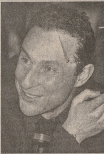
ჟან პიერ პაპენი

თუ პაპენს ნაკრებში არ უმართლებდა, სამაგიეროდ, ბრწყინვალე საკლუბო დონეზე — ოთხჯერ გახდა საფრანგეთის ჩემპიონი, ორჯერ იტალიაში მოიგო პირვე-