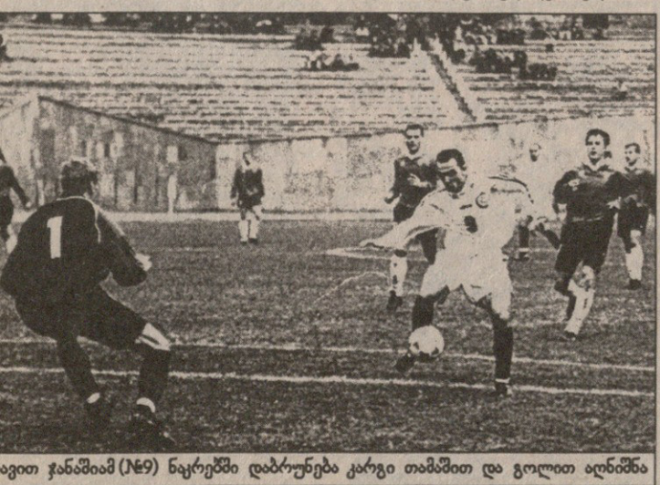
დავით ჯანაშიამ (№9) ნაკრებში დაბრუნება კარგი თამაშით და გოლით აღნიშნა