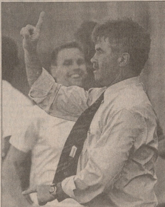
გუს ჰილდინკი ფეხბურთელებს თითს უქნევს

ფეხბურთელებმა იცინან, ან ყოველ შემთხვევაში უნდა იცოდნენ, ვინ არის გუნდში მთავარი და ვის ეკუთვნის გადაწყვეტი სიტყვა გასახდელში. „რეალის“ ზოგიერთ მთამაშეს თავი ვარსკვლავი ჰგონია, არადა, ასე არ არის. ახლა რატომღაც უკმაყოფილო ზედორი და პანუჩი მადრიდში არ იმყოფებიან —