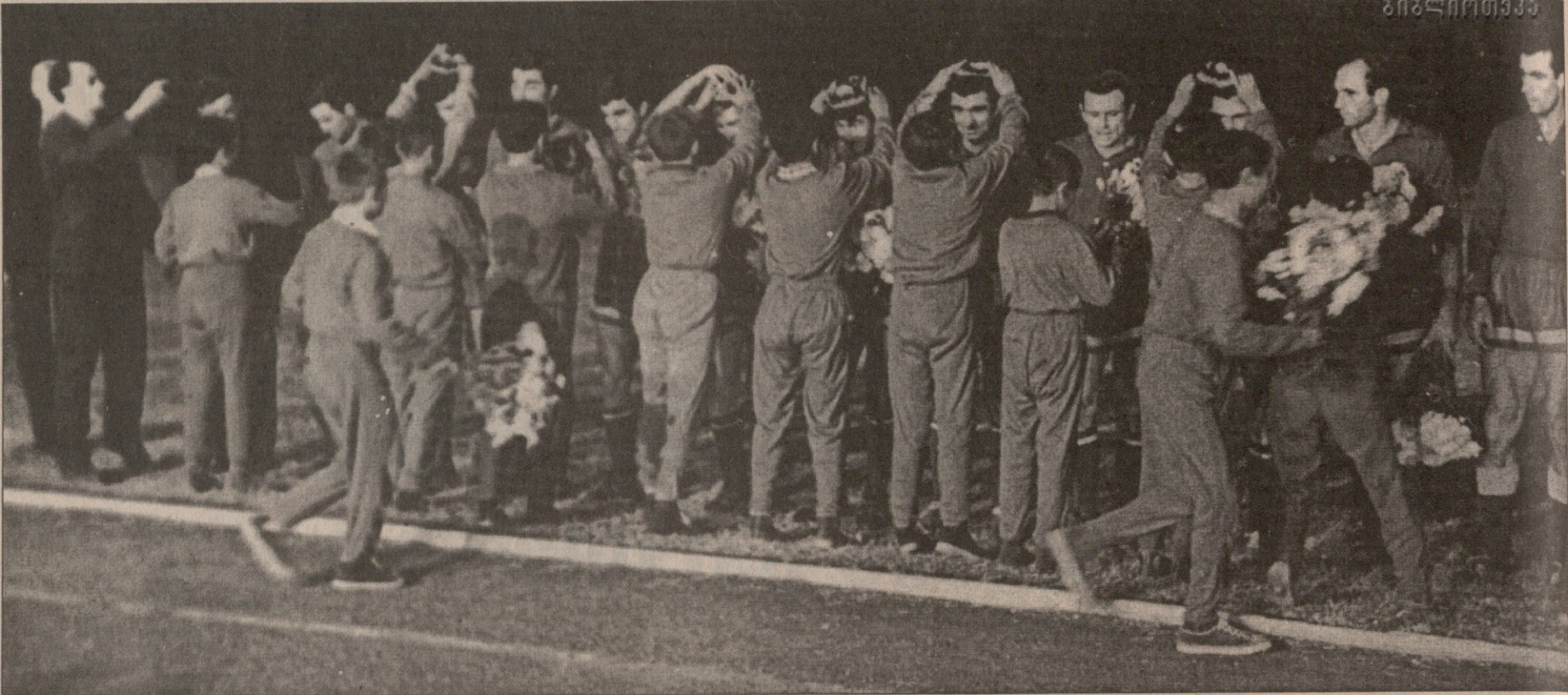
საბჭოთა კავშირის ახალი ჩემპიონების პირველი მიმლოცველები ტაშვინტელები იყვნენ