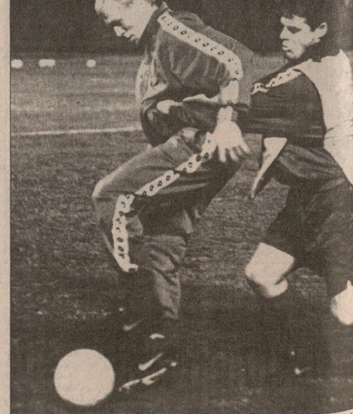
ესტონელებმა ეროვნული სტადიონის გაზონი გუშინვე გათელეს