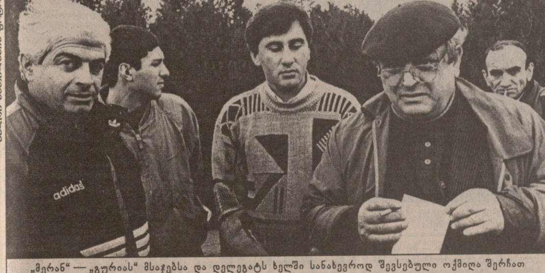
„მერან“ — „გურიას“ მსაჯებმა და დელეგატს ხელში სანახევროდ შევსებული ოქმიდა შერჩათ