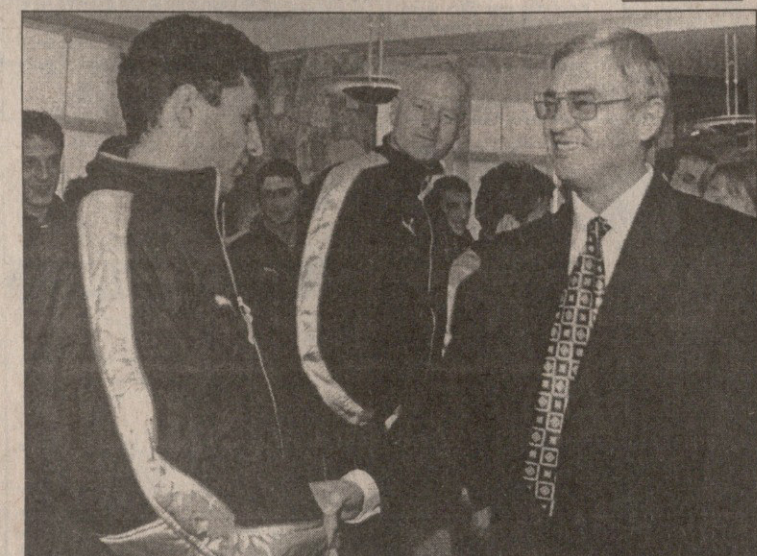
პრეზიდენტისა და ალბანეთის ნაკრების შეხვედრა. რეჟე მედიანი ნაკრების ნახევარმცველი იგლი ტარეს ესალმება

ის, თუ ვინ თამაშებს ბერძნების წინააღმდეგ, მხოლოდ მატჩის დროს ვაირკვევთ, თუმცა უკვე გამოჩნდა სავარაუდო სია. მირთადი შემადგენლობა დაახლოებით ასეთი იქნება: ფოტო სტრაკოშა, ილირ შულკუ, რუდი ვატი, ერენი ფაკაი, არიან ჯუმბა, ალტინ ჰაჯი, ბლენდარ კოლა, ალბან ბუში, ალტინ რაკლი, იგლი ტარე, მაჰირ ჰალილი.