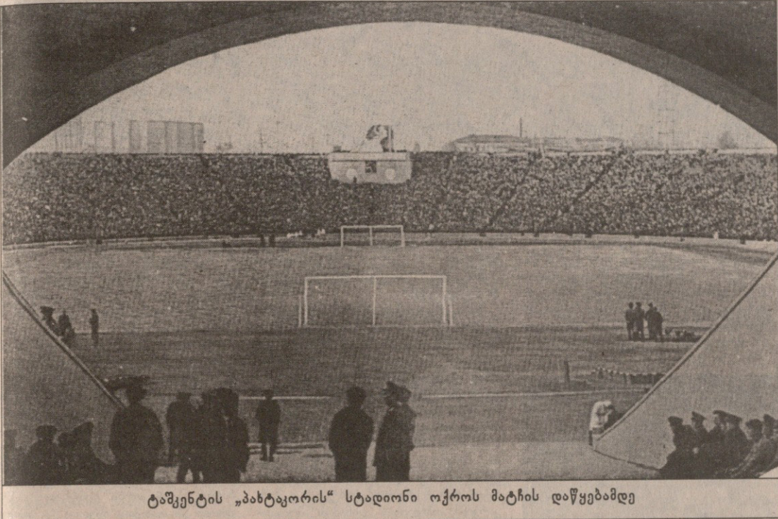
ტაშკენტის „ახტაჯორის“ სტადიონი ოქროს მატჩის დაწყებამდე