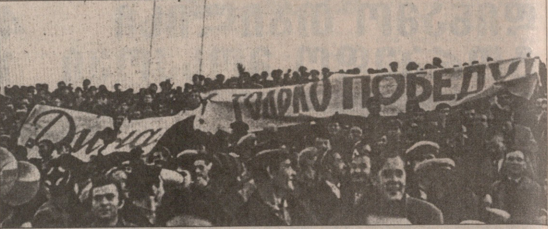
აღმოსავლეთ ტრიბუნაზე გაიშალა ტრანსპარანტი „დინამო“ — მხოლოდ გამარჯვება!

ერთადერთი დინამოსებრი გაცელება მოხდა მე-40 წუთზე, როცა მეტრეველმა სწრაფი დრიბლინგით ჩამოიტოვა სარაევი, კარის გასწვრივ ჩააწოდა ისე, რომ ბურთის გატანა შეეძლო ბარქაიასაც, დათუნაშვილსაც და მესხსაც, მაგრამ ვერც ერთმა ამ ჩაწოდებას ვერ მიუსწრო. შეხვედრის შემდეგ „ტორპედო“ კვლავ იერიშს იერიშზე ახორციელებს. და აი, 56-ე წუთზე მოსკოველებმა საწადელს მიადრწესეს. უნერგული შერბაკოვი ოთხ მეტრეტან ბრძოლაში დაეუფლა ბურთს და ძლიერი ღარტყმით გაგზავნა იგი თბილისელთა კარის დაბალ კუთხეში 1:0. ვინ იფიქრებდა, რომ ამ მიმე ვითარებაში დინამოელები შეძლებდნენ თამაშის სადავეების ხელში აღებას და მატჩის მსვლელობაში გარდატეხის შეტანას. მაგრამ სწორედ ასე მოხდა: მიღებული ბურთით თითქოს ხელ-ფეხი შეუსწრა ჩვენს ნახევარდაცვას და ფორვარდებს. მოშველები ზამბარა დაიჭიმა და შემდეგ ... აფეთქდა. ამ აფეთქების ნაკადები ტალღასავით დაიძრა ტორპედოელთა კარისკენ. მეტოქე დაიხანა. იგი არ მოელოდა ამ არანაშულ შტურმს, რომელიც წამდამწუწმ აწყდებოდა და ცვიის ზღუდეებს.