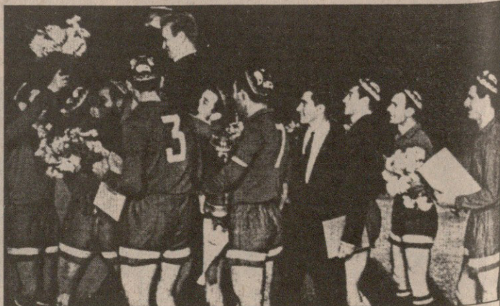
გამარჯვებულთა საბატო წრის შემოვლამდე დინამოელებმა მწვრთნელი გავრის კაპიტანი ხელში აიტაცეს

ფოტორეპორაჟები ალბომიდან „თბილისის დინამო ფეხბურთის ოლმპიკი“. ავტორები: გარან აკოვოვი და შოთა უდაბუკორია. მ. ზარგინიანი, მ. კვიციანიძის, ხ. ინანიოვის, ა. ხომინის, კ. პანიძის ფოტოები