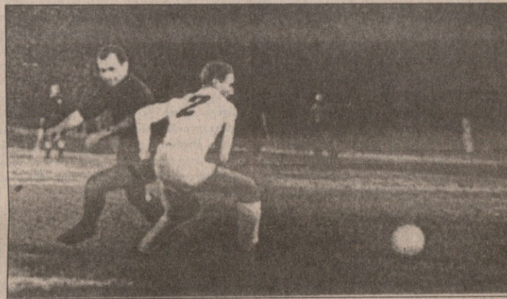
დაუფიწყარი მატჩი... დაუფიწყარი მესხი... დაუფიწყარი „მესხის ფინტი“...

(„სოვეტსკი სპორტის“ სპეც. კორესპონდენტი)