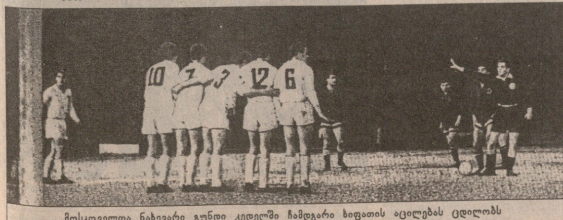
მოსკოველთა ნახევარი გუნდი კედელში ჩამდგარი ხიფათის აცილებას ცდილობს

სომხეთის სპორტი, ხუთშაბათი, 19 ნოემბერი, 1964 წელი