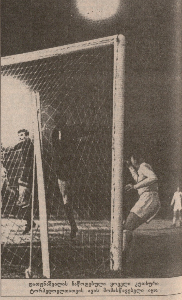
დათუნაშვილის ჩაწოდებული ყოველი კუთხური ტორპედოელთათვის ავის მომასწავებელი იყო