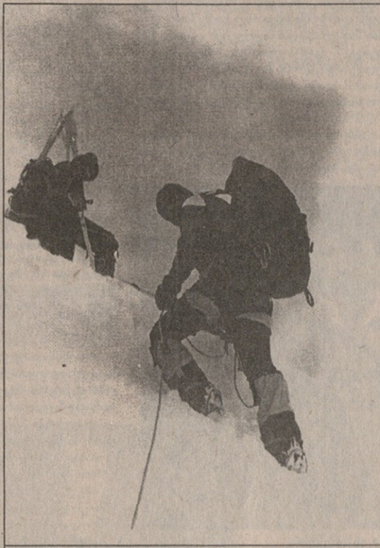
ჩვენები ცასაც მიუახლოვდნენ, მაგრამ...

გვიტოვებოდა, ჩანტლაძისა და ნე- მსიწვერების დაბრუნების მერე მან- სალუს ფერდობებზე რა მოხდაო.