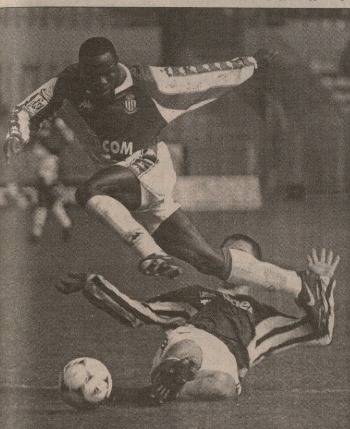
მონაკო — ოსერი. ვიკტორ იკებმა ბეგერს ეცადა, მაგრამ გოლი მაინც ვერ შეაგდო

როტერდამის "ფეიენორდმა", ჩემპიონატი ბრწყინვალედ დაიწყო და მოგვიანებით ქულეში მიმოფანტა, მასპინძელში იმარჯვა. მეორე გოლი, რომელიც არგენტინელმა ხულიო კრუზმა გაიტანა, მატჩის ულამაზეს გოლად ცნეს. 83-ე წუთზე