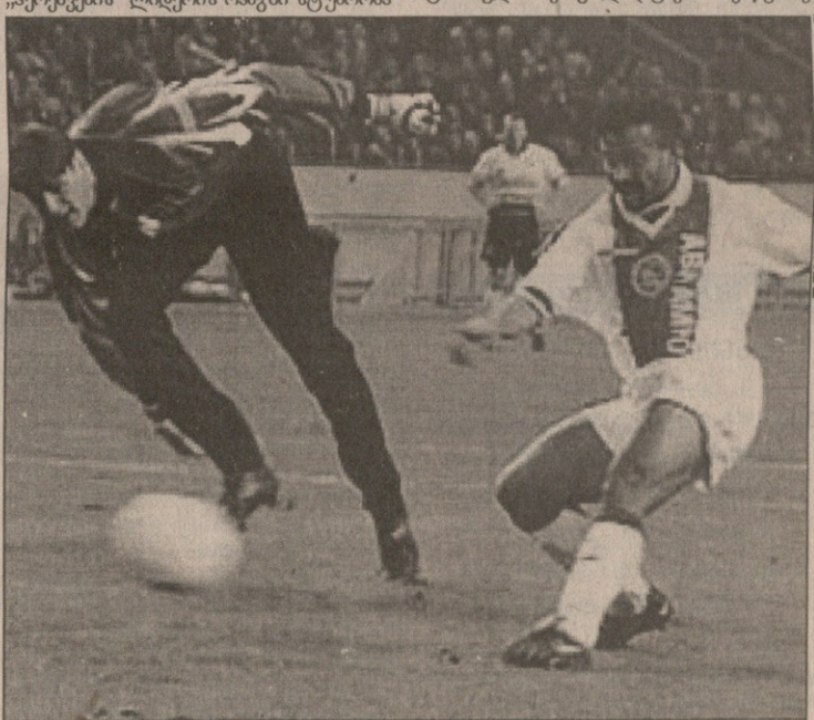
აიაქსი — როდა. პირველი გოლი კერკრადელთა კარში — ვამბერტოს დარტყმულმა ბურთმა მიხანს უწია

ტურის პირველი ორი მატჩი საშმატის ტარდა, "ნანტიმ" "ლე ავრის" დამარცხებულ შემდგომ, "მარსელმა" კი ზედმეტად შედეგად გაიმარჯვა, ამჯერად ნანსიში ოთხშაბათს, "ბორდოს" აუცილებლად უნდა დაეგეგო, რათა ლიდერი ძალიან წინ არ გაეხვია. ელი ბოპის გუნდმა დასახული ამონაბრწყინვალედ შეასრულა და "ლიონს" საშუალება არ მისცა, პირველი სახიფათო გამარჯვება ეხვია. მესამე ადგილზე "ლიონი" ჩემპიონ "ლანსს" ესტუმრა. სადაც, თუმცა გათამაშების ცხრილში უკვე პოზიციას ვერ დაკარგა. "მონაკომ" დამარჯვებულ ბრძოლაში აჯობა "ოსერს" და მეორე ადგილზეც მყარად დამკვიდრდა. მეორე კი "მონაელის" მძლევებმა "ლიონს" აიხადველა. ასე-ში კვლავ ვერ მოიგო, მაგრამ "მეიტან" და მეორე მატჩში ადგილზე დამკვიდრდა.