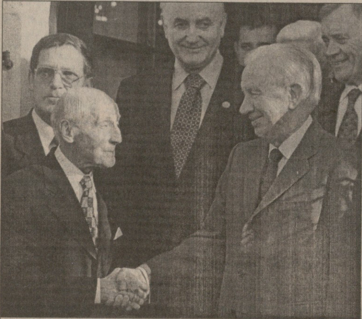
ლეონ შტუკელი ხუან ანტონიო სამარანჩმა სიდნეიშიც დაბატიყა

შტუკელი ოლიმპიური ორდენით 1987 წელს დაჯილდოვდა. განდიდება არც სამშობლოში აკლია — მისი პორტრეტი სლოვენურ ხურდა ფულზე და სატელეფონო ბარათებზეა გამოსახული. სადაც სამართალია, შტუკელი იუგოსლავიელებმაც უნდა დააფასონ: იგი ხომ ამ ქვეყნის პირველი ოლიმპიური ჩემპიონი იყო.