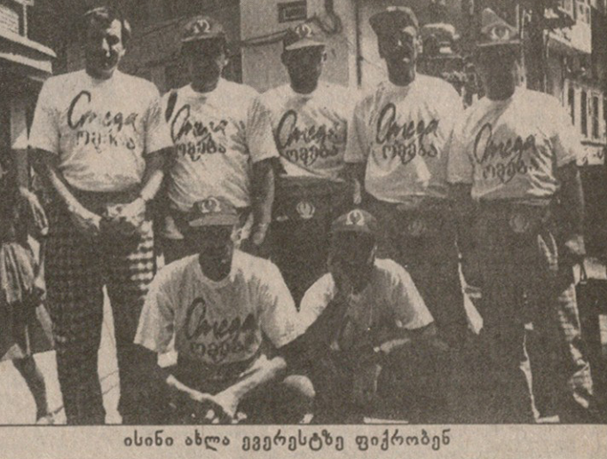
ისინი ახლა ევერესტზე ფიქრობენ