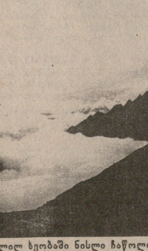
ჩვენი მთამსვლელების მიერ ამოვიღებ ხეობაში ნისლი ჩაწოლილა