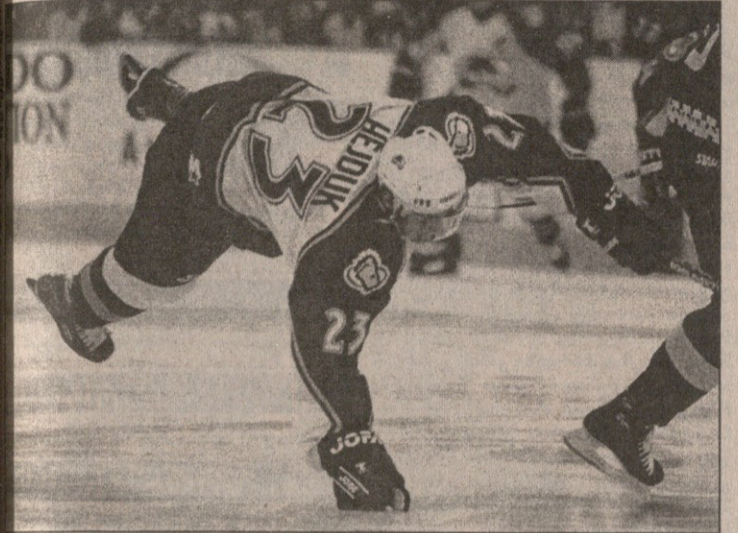
კოლორადოელი მილან ჰეიდუკი თავისი კლუბივით აყირავდა