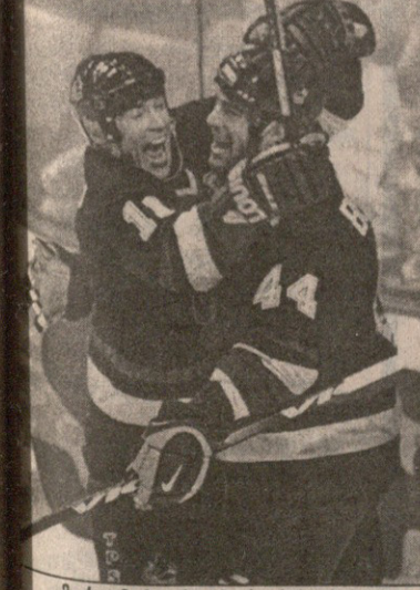
მარკ მესიეს (მარცხნივ) თანაგუნდელი ტოდ ბერტუტი მე-600 გოლს ულოცავს

23 ოქტომბერს ლევენდარულმა მარკ მესიემ უაღრესად საპატიო, 600-გოლიან ზღვარს მიაღწია, რაც ნაჟ-ის ისტორიაში მხოლოდ მეათედ მოხდა. ამ საიუბილეო გოლს მესიესგან ჯერ კიდევ შარშან ელოდნენ, მაგრამ პოკისტმა და მისმა კლუბმა ვანკუვერმაც ერთობ უფერულად ჩაატარეს სეზონი. ახლა კი ვარსკვლავმა დიდხანს არ ალოდინა და ჩემპიონატის დასაწყისშივე გაახარა თავისი თაყვანისმცემლები. კითხვაზე, მე-600 გოლი მისი კარიერის მწვერვალი ხომ არ იქნება, მესიემ უპასუხა, ამერიკად 700 გოლზე ვაცხადებ პრეტენზიას. კითხვაზე, მე-600 გოლი მისი კარიერის მწვერვალი ხომ არ იქნება, მესიემ უპასუხა, ამერიკად 700 გოლზე ვაცხადებ პრეტენზიას. 1. უეინ გრეცკი 886; 2. გორდი პოუ 801; 3. მარსელ დიონი 731; 4. ფილ ესპოზიტო 717; 5. მაიკ გარტნერი 708; 6. მარო ლემიე 613; 7. ბობი პალი 610; 8. დინო სი-სარელი 602; 9. იბარ კური 601; 10. მარკ მესიე 600 როგორც ამ სიიდან ჩანს, მარკ მესიემ ათ დიად პოკისტს შორის 80-იანი წლების ლევენდარული ედმონტონის მესამე წარმომადგენელია და თუ მას თავის მეგობარ გრეცკის დაწვევა გაუჭირდება, კიდევ ერთ ყოფილ პარტიზორს, იარი კურის და სხვა სამსხრებელ სნაიპერს, ალბათ, წლებულსვე გაუსწრებს.