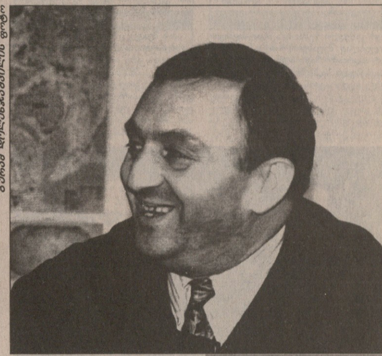
ბაზილიკაში 1990 წლის 28 დეკემბრიდან ოთხშაბათი, 28 იანვარი 1998 №195 (730) ღირსი 50 თეთრი