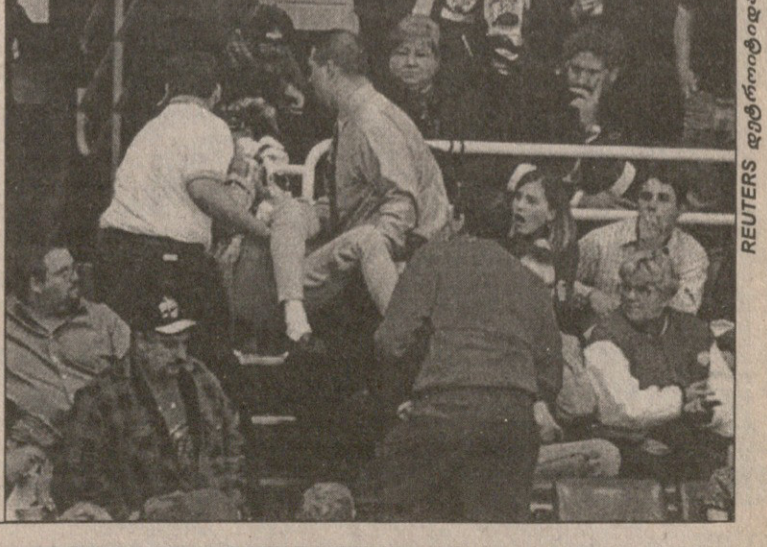
დეტროიტის ბორტსი იქით გადაფრენილმა შაბაში ისე სერიოზულად დაბამავა, რომ სამედიცინო დახმარება დასჭირდა

პარასკევს დეტროიტისა და ტორონტოს მატჩში მეტად კურიოზული ფაქტი მოხდა. ტრიბუნაზე მჯდომი ერთ-ერთი გულშემოტყვიარი ბორტს იქით გადაფრენილმა შაბაში ისე სერიოზულად დაბამავა, რომ სამედიცინო დახმარება დასჭირდა