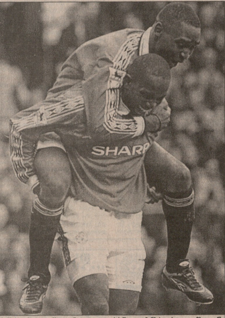
მანჩესტერი — უიმბლდონი. კოული იორკს შეაჯდა, მანჩესტერი — უიმბლდონს