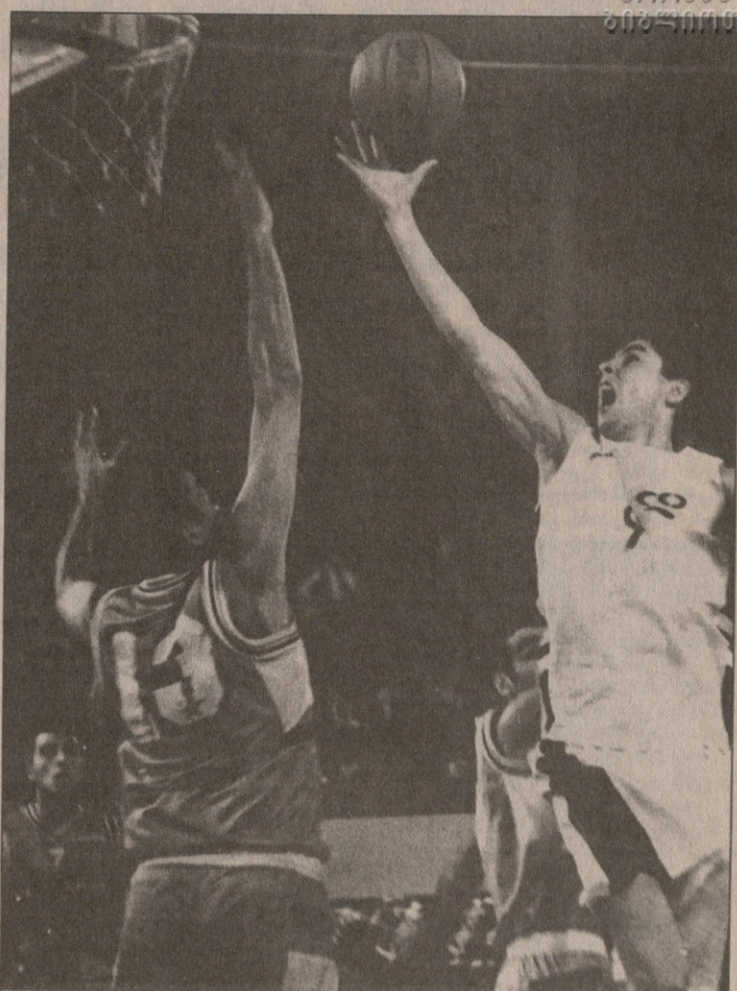
დინამოელი წიკლაური ამოღ დაშვრა

სამიანებმა ერთხანს „ვიტას“ დამშვიდების საშუალებაც მისცა, თუმცა მეტოქეც ზუსტად ინტელექტუალობა და ძირითადი დროის დამთავრებამდე 3 წუთით ადრე გამარჯვებულის ვინაობა კვლავაც გაურკვეველი იყო. ყოველივე ამან ახალგაზრდა დინამოელთა უდიდესი ძალისხმევა შეიწირა და, ალბათ, ამაღ იყო, დარჩენილი სამწუთეუ-