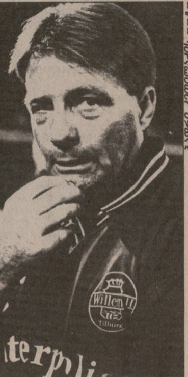
ტილბურგელთა თავკაცმა კო აღრიანსემ „ბეტისი“ ბრწყინვალედ შეისწავლა

ამ ეტაპზე კიდევ ერთი ესპანურ-ინგლისური პაექრობაა — პრემიერლიგის ერთ-ერთი ლიდერი ბირმინგემის „ასტონ ვილა“ ვიგოს სტუმრობს, სადაც „სეულტას“ შეხვედება. სხვათა შორის, „სეულტას“ ერთადერთი უეფას თასისთვის მოასპარევე იმ ხუთი ესპანური გუნდიდან, მეთექვსმეტეფინალის პირველ შეხვედრას შინ რომ ითამაშოს, „სეულტას“ ჩემპიონატში ჯერაც დაუპარცხებელია და ინგლისელებთან თამაშის წინ იმე-