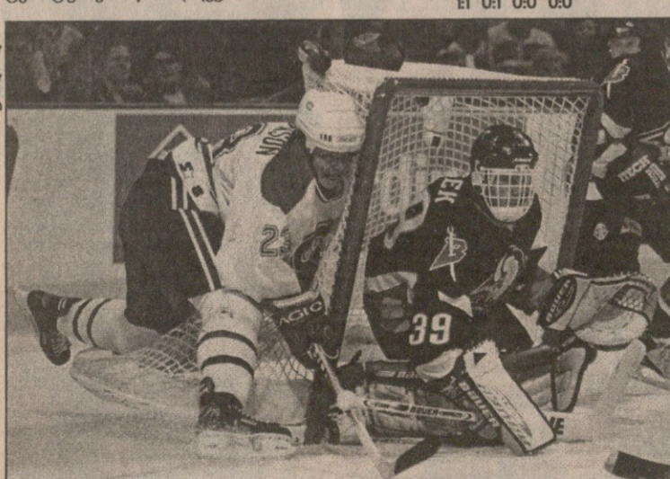
მონრეალელი ტერნერ სტივენსონი ბუფალოელებსაც შესესდა და ქელსაც

1:0 იუჰანსონი 21'42 (1); 1:1 ნელსონი 27'14 (1); 2:1 არვესონი 48'07 (2); 3:1 რედენი 56'31. პიტსბურგი — რინგბერი 3:3 0:1 2:1 1:1 0:0 0:1 პარი 10'32 (1); 0:2 გრეცი 24'50 (1); 1:2 ლეო 36'56 (1); 2:2 ლანგი 38'01 (2); 3:2 ჰემერი 45'35 (1); 3:3 პარი 53'35 (2). ჩაპაპო — დელასი 4:3 1:2 1:1 2:0 0:1 საიდორი 8'10 (2); 0:2 ლეპტი-ნენი 13'30 (2); 1:2 ამონტი 18'22 (3); 1:3 პალი 31'36 (1); 2:3 ფანო-ვი 35'19 (1); 3:3 ჩელიოსი 40'23 (1); 4:3 მორო 45'38 (1). სინტ ლუისი — ბილინგამი 0:1 0:0 0:1 0:0 0:1 ბერარი 36'08 (1). ვანკუვერი — ტორონტო 4:1 1:1 1:0 2:0 0:1 კოტი 1'28 (1); 1:1 ოლუნდი 18'43 (1); 2:1 მესიე 38'34 (2); 3:1 ბერ-ტუტი 41'57 (1); 4:1 მეი 54'02 (1). 18 ოქტომბერი სან ხოსე — ბოსტონი 0:3 0:2 0:1 0:0 0:1 ფერარო 3'24 (1); 0:2 სამსონოვი 16'34 (2); 0:3 ხრისტიჩი 20'19 (2). ტამაზა — ვაშინგტონი 1:4 0:1 0:1 1:2 0:1 ფინო 4'10 (1); 0:2 ბონდრა 38'15 (2); 1:2 ანდერსონი 40'36 (1); 1:3 პერი 43'04 (1); 1:4 შვეიკოვსკი 51'49 (1). დებიუტი — კალებარი 2:0 0:0 1:0 1:0 1:0 დანდენო 35'10 (1); 2:0 შენაპანი 48'21 (5). ლუს ანჯელუსი — კოლორადო 5:5 1:1 2:2 2:2 0:0 0:1 დემარში 8'26 (2); 1:1 მ. ჯონსონი 18'34 (1); 2:1 ნორდსტრომი 28'54 (1); 2:2 დროვი 31'19 (1); 3:2 ბლევიკი 33'30 (1); 3:3 საკივი 35'38 (4); 4:3 მიურევი 44'51 (1); 5:3 პერი 58'28 (4); 5:4 ლეფტერი 59'10 (1); 5:5 ლემიე 59'35 (1). სანგეალ ლარბიანი