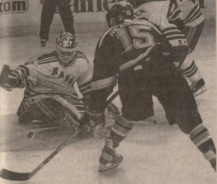
ნიუიორკელთა თავგზაბანული მეკარე მაიკ რისტერი სენტლუისელმა რუდი რიზონერმა (15) შეაწუხა

მაიხები: 0:1 მაკინისი 4'56 (1); 0:2 მაკინისი 11'49 (2); 0:3 მაკინისი 16'48 (3); 0:4 კორტნოლი 29'05 (1); 1:4 ლიხი 43'58 (1); 2:4 კარპოვევი 51'34 (1) სენტ ლუისის ისტორიაში ბრეტ ჰალი ელ მაკინისმა შეცვალა. საოცრად შედეგიანმა კეისტმა პირველივე პერიოდში შეუტია მასპინძელთა კარს და გამოკლდო მაცი ისტორიის ისე დააბნია, რომ ამან არათუ ახლო, შორი მანძილიდან დარტყმული შაბაც კუშა. სულ რაღაც 12 წუთში მაკინისმა პე-თორიტი შესარულა და მატჩის ბედიც დაწვეტა რეინჰარსის საქმე კი ისე ცუდად მიდის, ზედიზედ სამჯერ დამარცხებულ პერიოდებს საკუთარმა ქომაგებმა კი უსტიყენს. „მედისონ სკუერ გარდენს“ მხოლოდ მაშინ აღმოხდა სიხარულის ყიფინა, როდესაც დეიტონამ გამოაცხადა, მატჩის პერიოდული კეიტბურთელი დევიდ უელსი ესწრებაო.