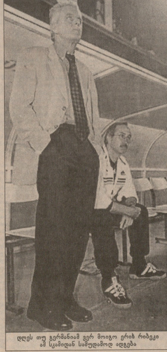
დღეს თუ გერმანიამ ვერ მოიგო ერის რიბეკი ამ სკამიდან სამუდამოდ ადგება

ფრანც ბექენბაუერმა და კარლ-ჰაინც რუშნიცემ, როგორც ბევრმა სხვამ, რიბეკს დასდეს ბრალი. „ოლივერ ბირჰოფისა და ულფ კირსტენის ერთად თამაში მცდარი მგონია. ისინი ზუსტად ერთი ტიპის თავდამსხმელები არიან — ძლიერი საპერო დეფენსი, ტექნიკურად კი ცოტა მოიკოჭლებენ. ამიტომ უკეთესი იქნებოდა, რიბეკს რომელიმე სთივის ოლივერ ნიოვილი შეეწყვილებინა, რადგან იგი ძალიან სწრაფია, კარგი დრიბლინგი აქვს და ბევრს მოძრაობს. ამით მცველთა ყურადღება გადააქვს და პარტნიორს მეტ თავისუფლებას აძლევს“ — ასეთია „კაიზერ ფრანკის“ აზრი, რომელსაც რუშნიცეც სავსებით ეთანხმება.