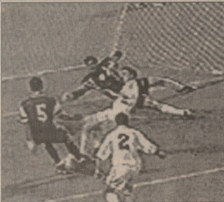
კულაკიოტისმა (№5) სოლოლაშვილის მოგერიებულზე ჭანკოტაძეს დაასწრო

მატჩის პირველივე წუთზე შეეძლოთ ჩვენებს დაწინაურება — ვერ ივარგეს. მერე სამი-ოთხი მომენტი სტუმრებს შეეძნათ — ესენიც დიდი ბედოვლათები იყვნენ. შემდეგ მსაჯმა მასპინძელთა მცველი გააძევა, ყველანაირი უპირატესობა ჩვენსკენ იყო, თუმცა მოსხოვიანისის უხეშობის წუთშივე გოლი გაუშვეთ. ოფსაიდს ქმნიდნენ ფეხბურთელები, ლიბერი ჭანკოტაძე კი თავდამსხმელს წინ ედგა. გოლი გოლს მოჰყვა, თანაც ულამაზესი, რევაზიშვილმა ისეთი შვავლო, მგონი ქართველებს აქამდე არც გაუტანიათ. ჩვენები გამხიარულდნენ, იმტაზე მოვიდნენ, ისედაც ჭკვიანურად მოთამაშენი ლატვიის მატჩთან შედარებით, უფრო გონივრულად ათამაშდნენ, სახიფათო მომენტებიც საკმაოდ შექმნეს, მაგრამ მეტოქემ უფურადღებობისთვის ისევ დაგვსაჯა. ჩხეტანს არ აპატია ზედმეტობა. წამოიღეს ქართველებმა ბურთი, ბერძნებს შტურმის მაგარიც კი მოუ-