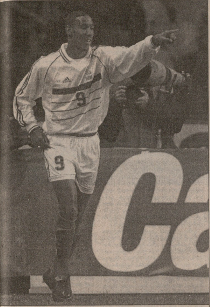
ფაკესგან განსხვავებით ლემერიმ ანელა ნაკრებში გამოიხატა და შედეგაც იმის