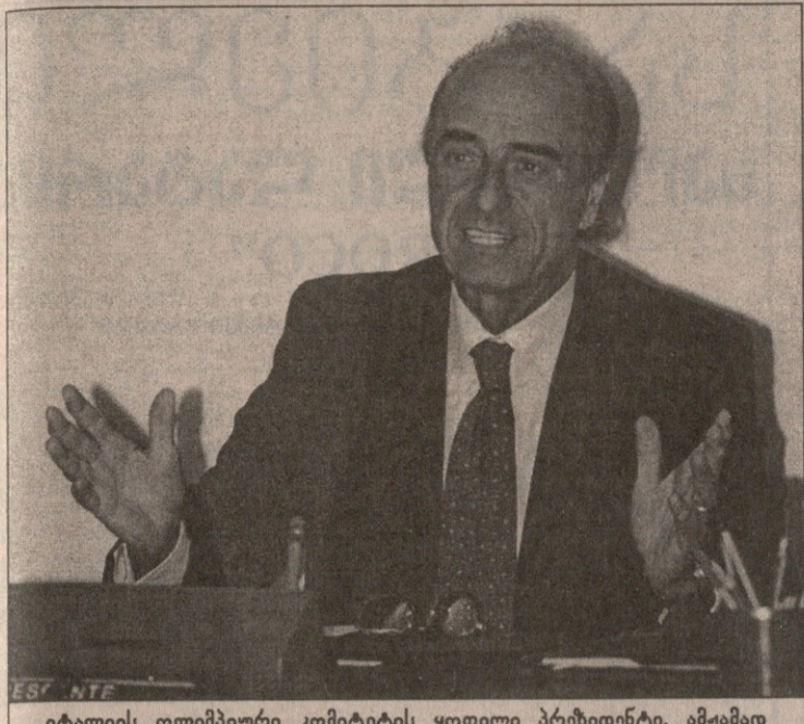
იტალიის ოლიმპიური კომიტეტის ყოფილი პრეზიდენტი, ამჟამად პატიმრობაში მყოფი მარიო პესკანტი