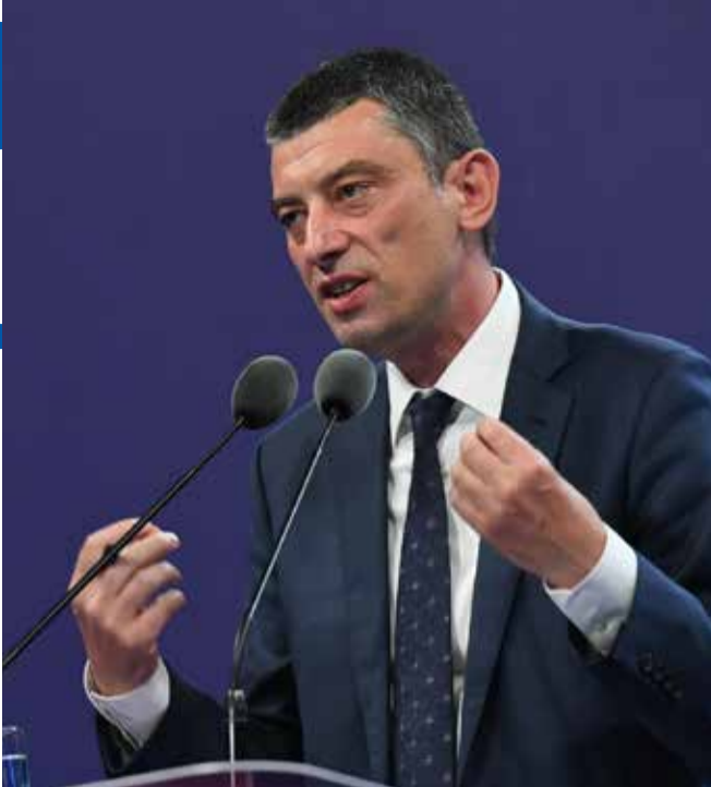
ნიშუმ, არასერიოზულია – ფაქტობრივად, პირდაპირ დაცვის მხარეს აძლევს მათთვის სასარგებლო განცხადებებს.

მეორე – ის ქვეყნის ყოფილი პრეზიდენტი და პოლიტიკურად მნიშვნელოვანი ფიგურაა. სააკაშვილის მიმართ ძალაში უკვე შესულია სასამართლოს ორი გადაწყვეტილება, რომლებიდანაც ჩემთვის ერთ-ერთი ყველაზე მძიმე, გირგვლიანის საქმეში მისი წვლილია, რაც შეწყალებაში გამოიხატა. ერთ-ერთი მტკიცებულება ამ საქმეში ადამიანის უფლებათა ევროპული სასამართლოს გადაწყვეტილებაა, სადაც ძალიან ცხადადაა წარმოდგენილი მაშინდელი პრეზიდენტის როლი შეწყალების ნაწილში. შესაბამისად, საზოგადოების დიდი ნაწილის მოლოდინი, რომ სააკაშვილის მიმართ მიღებული გადაწყვეტილებები აღსრულდეს, ძალიან დიდია. მეც ვფიქრობ, მის მიმართ სასამართლო გადაწყვეტილებები უნდა აღსრულდეს, მაგრამ ისე, რომ კითხვის ნიშნები არ გაჩნდეს. რა თქმა უნდა, ამაზე პასუხისმგებლობა ყოველთვის ეკისრება ხელისუფლებას. გახსოვთ, დაკავებიდან ძალიან მალე, პრემიერი გამოვიდა და განაცხადა, თუ კარგად არ მოიქცევა, დავუმატებთო, მაგრამ ეს ასე არ ხდება სამართლებრივ სახელმწიფოში, მი-