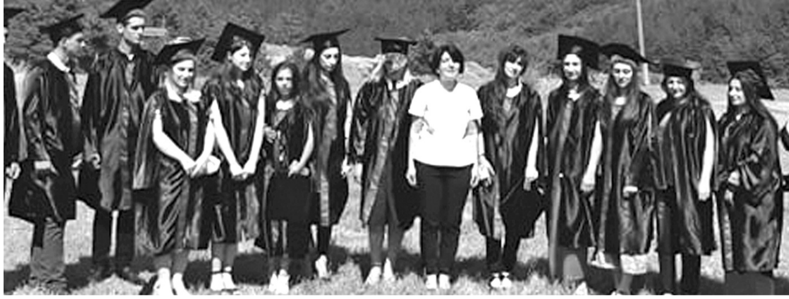
დოს ჩვენმა უნივერსიტეტმა.