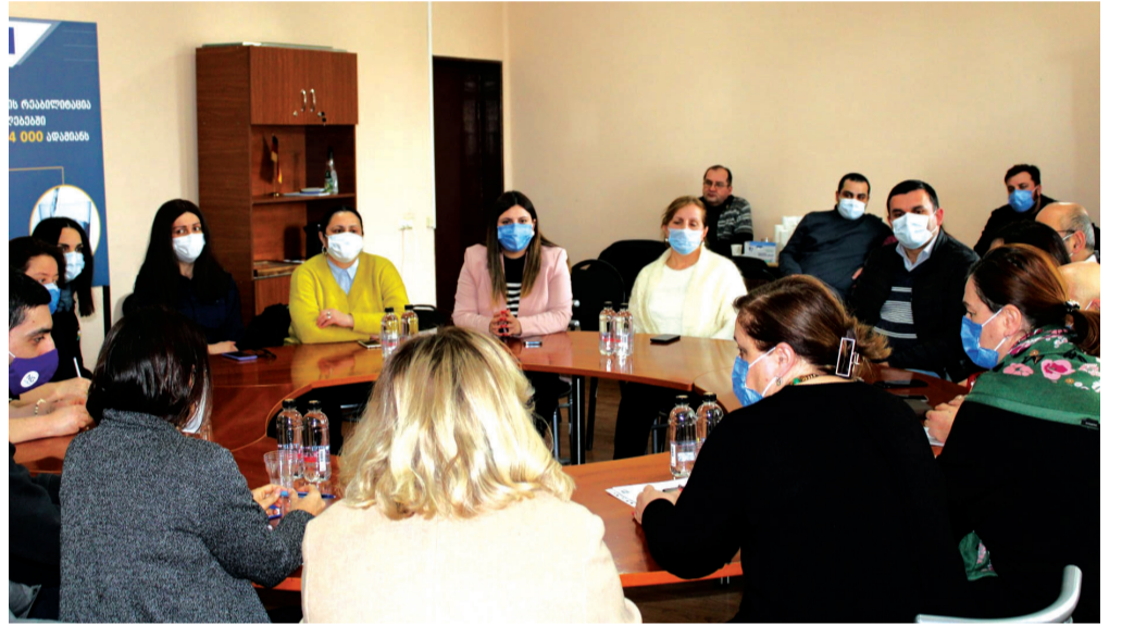
სტუმრებმა დადებითად შეაფასეს საშურის გენდერული საბჭოს მიერ გადადგმული ნაბიჯები და გამოხატეს მზადყოფნა თანამშრომლობისკენ.

საბჭოს წევრებმა ისაუბრეს საზოგადოების წინაშე არსებულ გამოწვევებზე, კერძოდ, ქალთა მიმართ და ოჯახში ძალადობაზე, საზოგადოების ცნობიერების კუთხით არსებულ პრობლემებზე და მათი დაძლევის გზებზე.