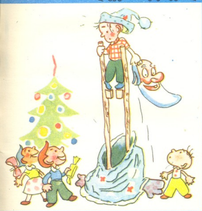
ლიტერ საბავშვო ჟურნალიდან