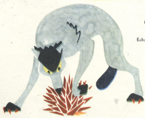
ნახატი ვ. ბელიჩიხვილინა