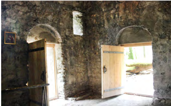
სურ. 27. მაჭის ციხის ეკლესია