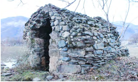
სურ. 1. საყდარი სოფ. განჯალაში