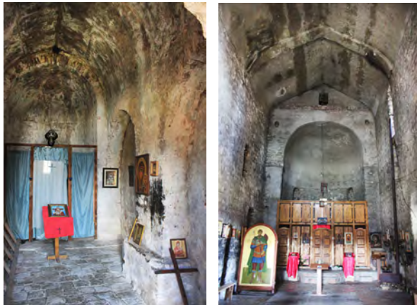
სურ. 21-22. წმ თევდორეს ეკლესია სოფ. ლელიანში