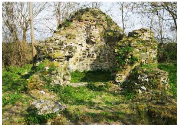
სურ. 3. ეკლესია სოფ. ვარდისუბანში