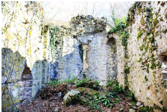
სურ. 40. ეკლესია (ლაკო/წმ ნინო) მსხალგორში