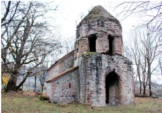
სურ. 48. არქიტექტურული კომპლექსი (წმინდა სამება) სოფ. ფონაში