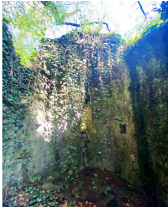
სურ. 45. რაჭისუბნის ეკლესია