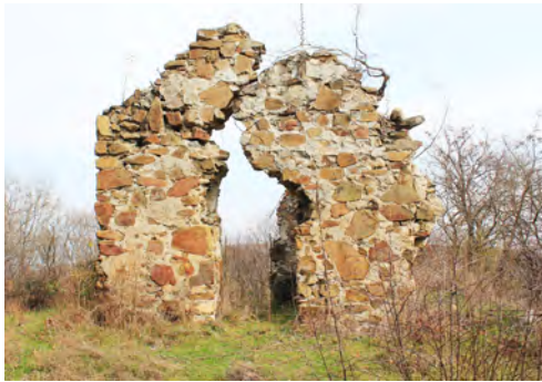
სურ. 9. მთავარანგელოზთა სახელობის მონასტრის საფლავზედა ეკლესია