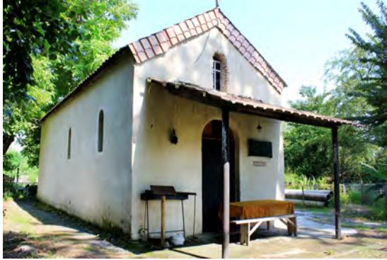
სურ. 47. ეკლესია (წმ გიორგი) სოფ. ფოდანში