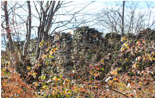
სურ. 30. მაჭის ქარვასლა