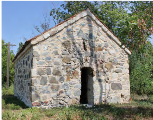
სურ. 42. ეკლესია (წმ თევდორე) ნაწისქვილარში