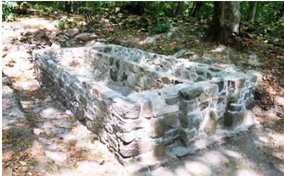
სურ. 39. სამონასტრო კომპლექსის ორნავიანი საწნახელი მსხალგორში