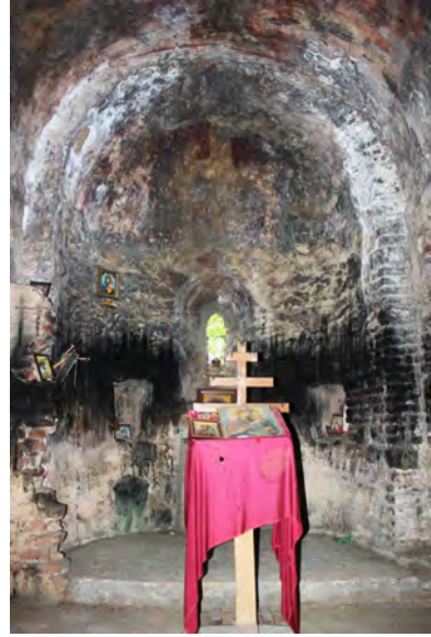
სურ. 56-57. ღვთისმშობლის ეკლესია სოფ. ხომატიანში