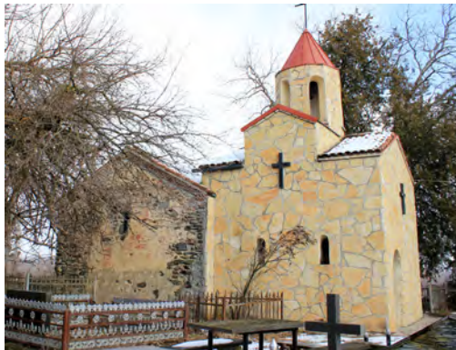
სურ. 43. ეკლესია (ღვთისმშობელი) ონანაურში