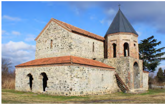
სურ. 20. წმ თევდორეს ეკლესია სოფ. ლელიანში