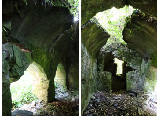
სურ. 15-16. ლაგოდეხის მონასტერი (ქოჩალოს ბაზილიკა)