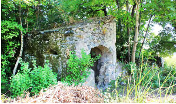
სურ. 53. ბაზილიკა სოფ. შრომაში