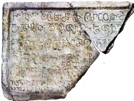
სურ. 5. მთავარანგელოზთა სახელობის მონასტრის წარწერა