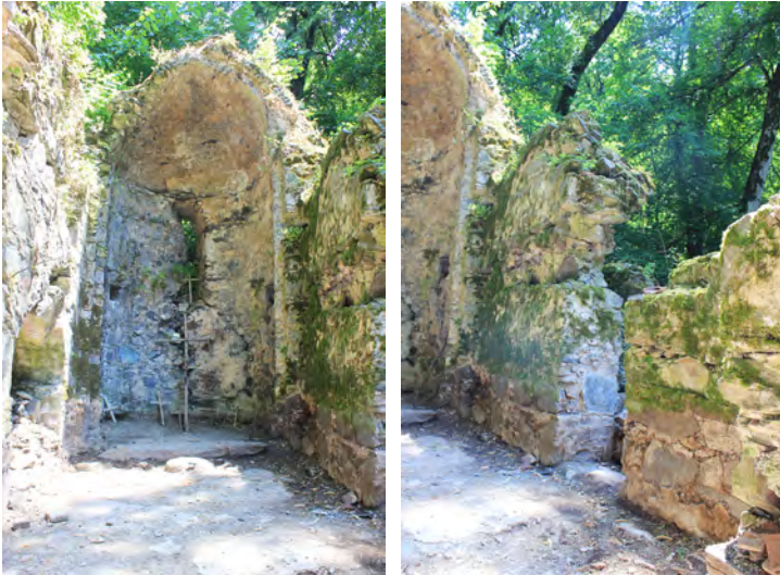
სურ. 13-14. ლაგოდეხის მონასტერი (ქოჩალოს ბაზილიკა)