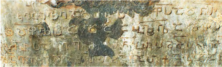
სურ. 12. ლაგოდეხის მონასტრის (ქოჩალოს ბაზილიკის) წარწერა