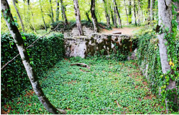
სურ. 29. მაჭის ციხის ღია ავზი