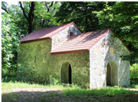
სურ. 46. ეკლესია (წმ გიორგი) სოფ. საქობოში