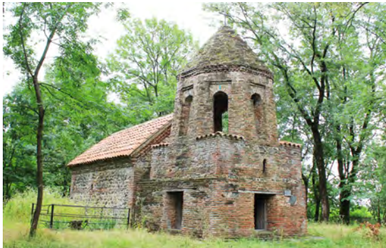
სურ. 55. ეკლესია (დვთისმშობელი) ეკლესია სოფ. ხომატიანში