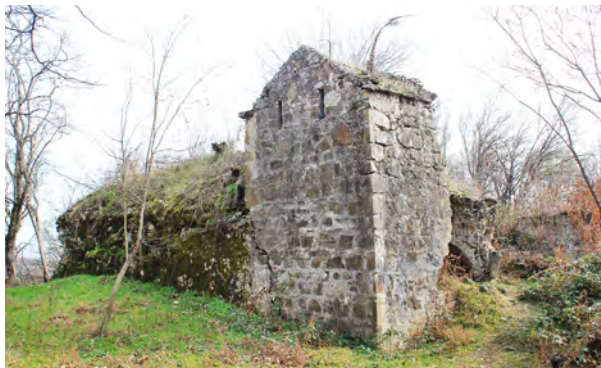
სურ. 6. მთავარანგელოზთა სახელობის მონასტრის ბაზილიკა