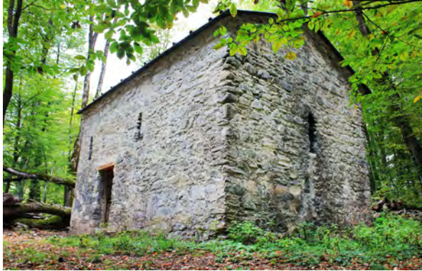
სურ. 26. მაჭის ციხის ეკლესია