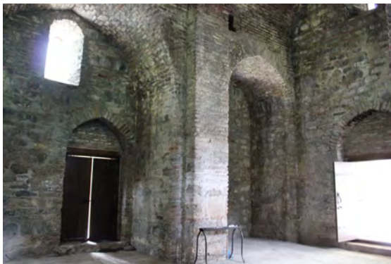
სურ. 49. არქიტექტურული კომპლექსი (წმინდა სამება) სოფ. ფონაში