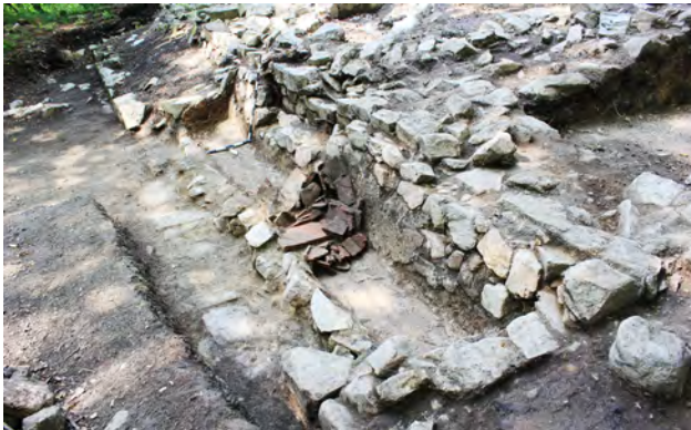
სურ. 34. სამონასტრო კომპლექსის ბაზილიკის საწნახელი მსხალგორში