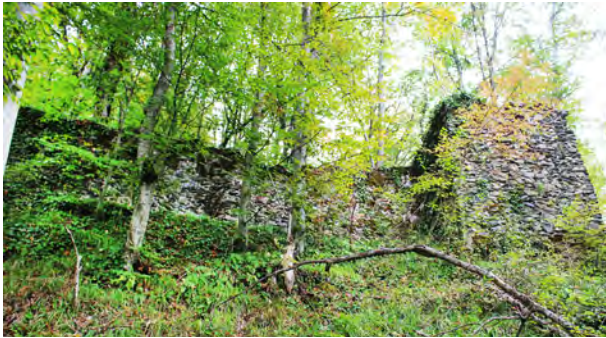
სურ. 24. მაჯის ციხის შიდა ციხე