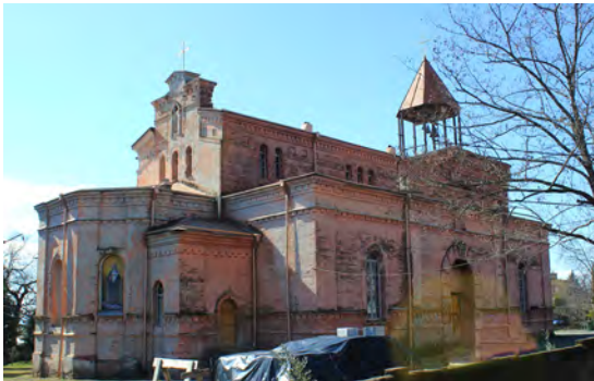
სურ. 18. ყაზანის ღვთისმშობლის ხატის ეკლესია