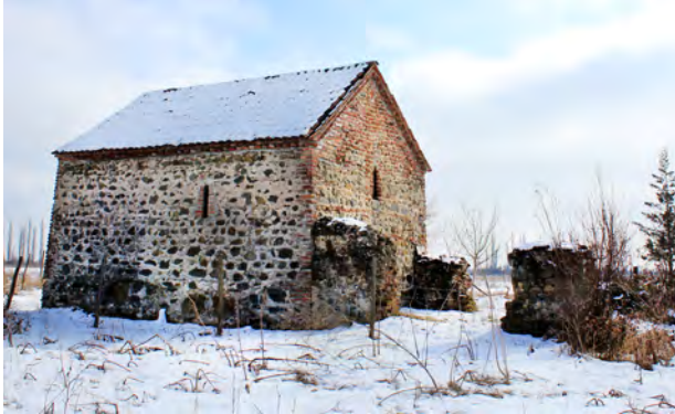
სურ. 23. ეკლესია (ჭრული საყდარი) სოფ. ლელიანში