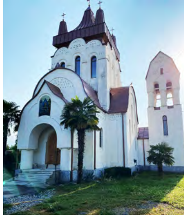
სურ. 4. კარდისუბნის ღვთისმშობლის ეკლესია