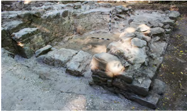
სურ. 33. სამონასტრო კომპლექსის ბაზილიკა მსხალგორში