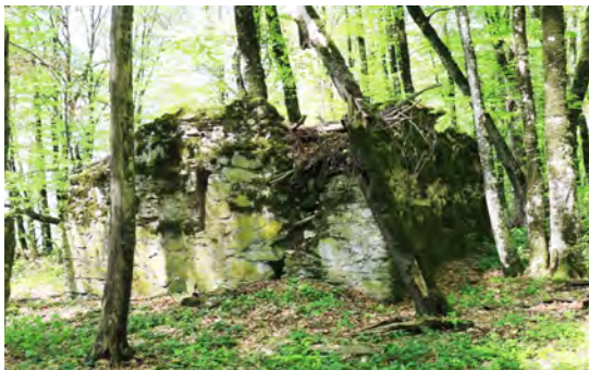
სურ. 51. ეკლესია სოფ. შრომაში