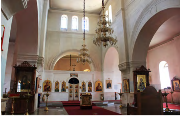
სურ. 19. ყაზანის ღვთისმშობლის ხატის ეკლესია