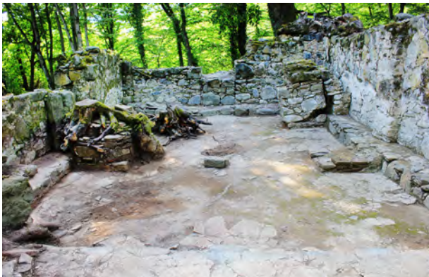
სურ. 37. სამონასტრო კომპლექსის დარბაზული ეკლესია მსხალგორში