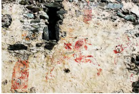
სურ. 44. ეკლესია (ღვთისმშობელი) ონანაურში