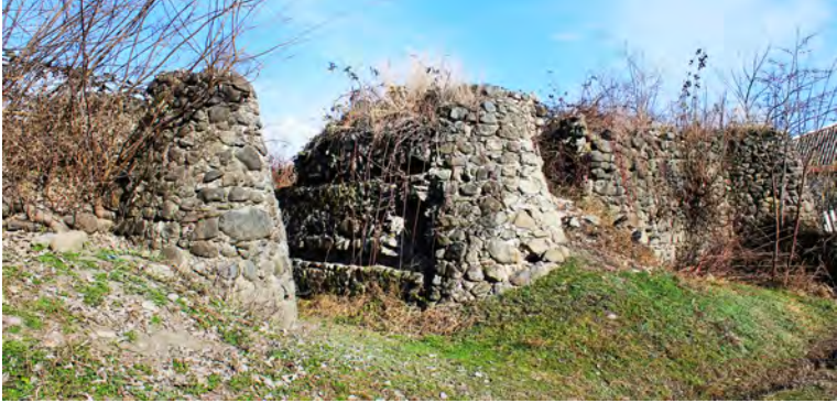
სურ. 11. ქარვასლა სოფ. კაბალში