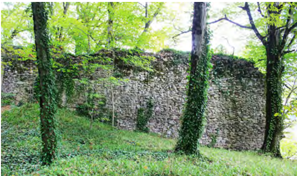
სურ. 25. მაჯის ციხის გალავანი