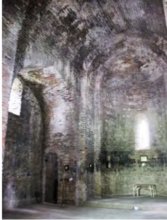
სურ. 50. არქიტექტურული კომპლექსი (წმინდა სამება) სოფ. ფონაში