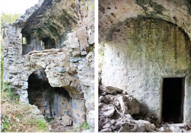
სურ. 7-8. მთავარანგელოზთა სახელობის მონასტრის ბაზილიკა