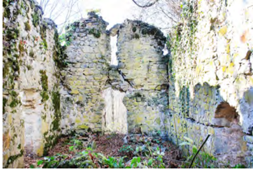
სურ. 41. ეკლესია (ლაკო/წმ ნინო) მსხაღგორში