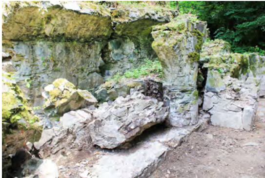
სურ. 17. ლაგოდეხის მონასტერი (ქოჩალოს ბაზილიკა)