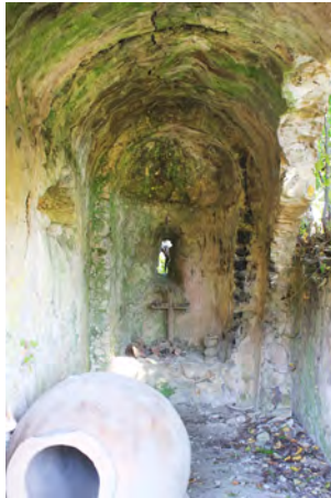
სურ. 54. ბაზილიკა სოფ. შრომაში