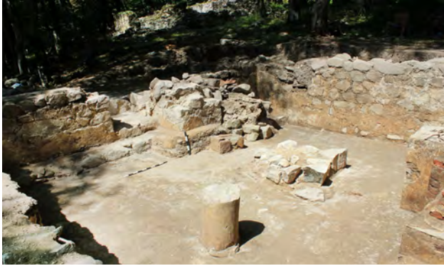
სურ. 32. სამონასტრო კომპლექსის ბაზილიკა მსხალგორში