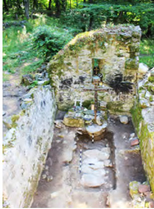
სურ. 38. სამონასტრო კომპლექსის დარბაზული ეკლესია მსხალგორში