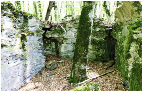
სურ. 52. ეკლესია სოფ. შრომაში