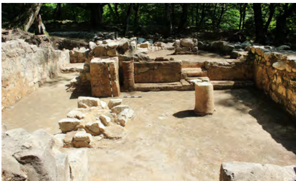
სურ. 31. სამონასტრო კომპლექსის ბაზილიკა მსხალგორში