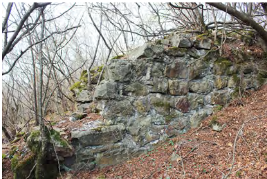
სურ. 10. ციხის კედლის ფრაგმენტი თელაში