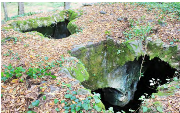
სურ. 28. მაჭის ციხის წყლის დახურული ავზი