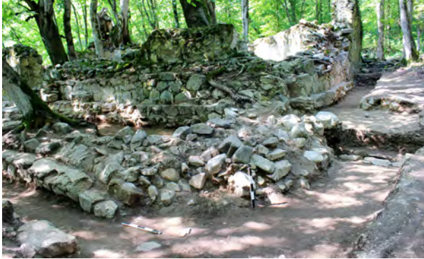
სურ. 35. სამონასტრო კომპლექსის დარბაზული ეკლესია მსხალგორში