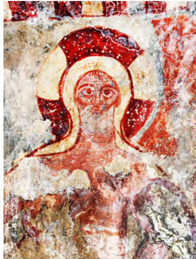
სურ. 58-59. ღვთისმშობლის ეკლესია სოფ. ხომატიანში