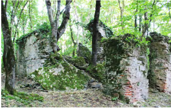
სურ. 2. ეკლესი (წმ გიორგი) სოფ. გურგენიანში