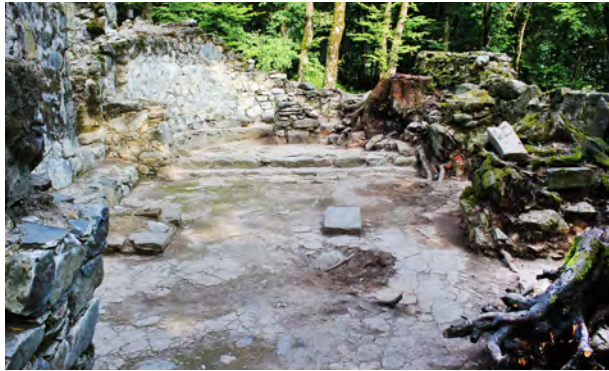
სურ. 36. სამონასტრო კომპლექსის დარბაზული ეკლესია მსხალგორში