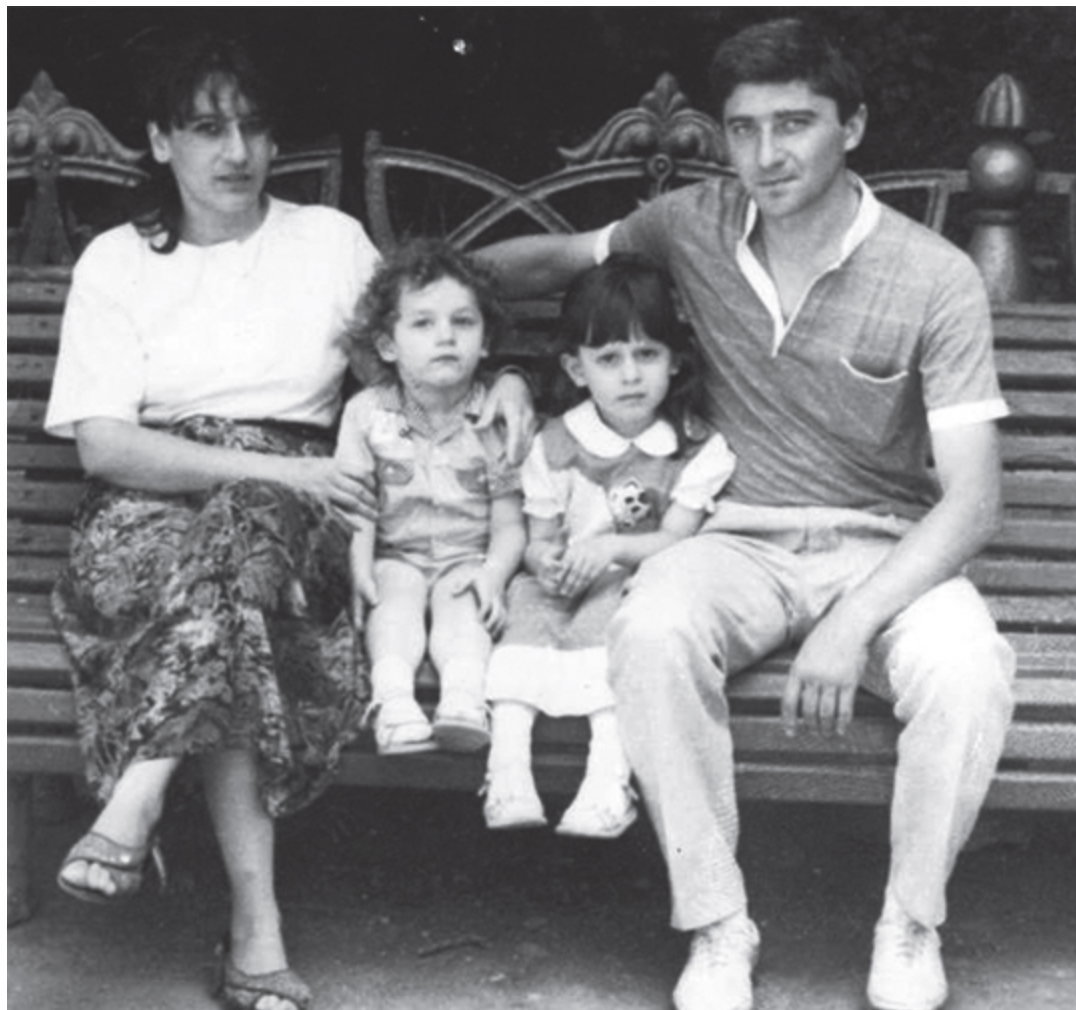
დასთან და მშობლებთან ერთად

არასდროს მეონია განცდა, რომ ვინმეზე ნაკლები ვარ იმის გამო, რომ ქალი ვარ, და ეს, ჩვენი რეალობის გათვალისწინებით, ძალიან მნიშვნელოვანია»