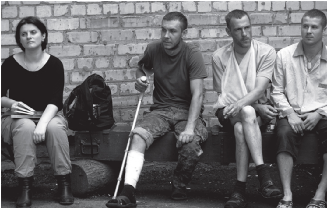
უკრაინელ ჯარისკაცებთან ერთად

ზღაპარს მოგითხრობ გოგონაზე საქორწინო ბეჭდით ხელზე – მარცხენაზე – რომ დადიოდა და ტიროდა დროგამოშვებით უფრო ხშირად კი უბრალოდ დადიოდა სახურავებით ვიადუკებით ამოსუნთქვებით ხელისგულებზე გაცილებით აბრეშუმით ზედაპირებით სწორეთი და კონუსისებრით და ამოთქვამდა მზეს მოგიყვები რათა შენ მას არ აწყენინო ჩამარხულო იმ ამფორასავით მოცეკვავე გოგოს ფიგურა რომ ახატია