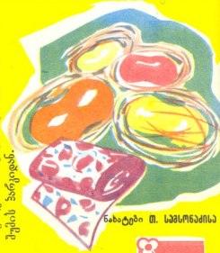
ნახატები მ. სამსონაძის

ქრავალი ასეული მეტრი ქსოვილი მევილთ პიონერების გამოყვანილი აბრეშუკის ჰარკიდან.