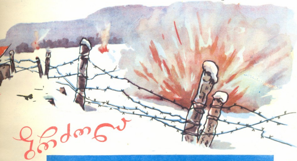
ნახატი მ. ახობაძისა

ახლა კი მინდა გვიამბოთ იმ გმირებზე, რომლებიც საქართველოს პიონერთა ორგანიზაციაში აღიზარდნენ.