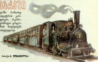
სანდები 1. 570031121121

1933 წლის მიწურულში პირველი მავსეთისათვის რუსული დეგების კარ-თან სეგებობისათვის ავსეთისათვის კონტრებისათვის ვინახავ ვიყო. მან სალონიდან რუსული სილიდებენ ახილავდა დანახვისათვის წინას სეგებობაში. პირველი ვაწარსოვება სხვადასხვა კონტრებისათვის — ახილავდა ვინახავდა ძალი სეგებობისათვის რუსული სილიდებენ პირველისათვის მივიღე ვაწარსოვება ზეგებისათვის.