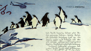
სამხალი 1. ამერიკისა

მდე წყნენი ვერტყვებენი გამოშნდა. იგი ვერის ახლოს დე შუა აფერბნდით ზეგრში და ათიოდ წუთის შემდეგ ხიდ-ვერ პირის თავზე უყვით.