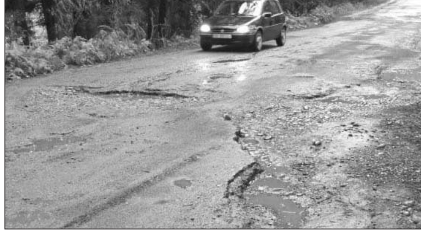
მოქმედ ორგანიზაციებს, თუმცა, როგორც ვაივით, მშენებლობა ბოლომდე არ არის მიყვანილი. მშენებლობის ვადა კი კარგა ხნის ამოწურულია.

მინც იღრმობს და მინიმუმ ოზურგეთის ავერსის კლინიკის საგზურს გაინადრებს... ანასეულის გზის ასეთი საგალალო მდგომარეობა ორი ძიძის ხელში ჩავარდნის შედეგია. პირველი ძიძა ქალაქის მერიაა, რომელმაც ეს საქმე რატომღაც ყოველთვის სახვალად გადადო, მეორე ძიძა კი, წყალსადენის მშენებელი ორგანიზაცია გახლავთ. რამდენადაც ვფლობთ ინფორმაციას, ქალაქის მერია და წყალსადენის მშენებელი ორგანიზაცია შეთანხმდნენ, რომ წყალსადენის მშენებლობის დამთავრების შემდეგ, ეს გზა კაპიტალურად გაეკეთებინათ ერთობლივი ძალებით. ახალი წყალსადენი, დროდადრო შეფერხებით, წყალს უკვე აწვდის ანასეულის მოსახლეობას და აქ