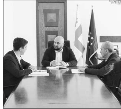
ოზურგეთი თანამედროვე და კომფორტული ქალაქი იქნება! – აღნიშნა, ოზურგეთის მერმა ავთანდილ თალაკვაძემ.

ოზურგეთის მუნიციპალური მომსახურების სერვისცენტრს ახალი ხელმძღვანელი ჰყავს. ალნიშნულ თანამდებობაზე გაა ანთაქე დღეს დაინიშნა. „კიდევ ერთი საკადრო გადაწყვეტილება მივიღეთ: მუნიციპალური მომსახურების სერვისცენტრს გაა ანთაქე უხელმძღვანელებს. მას მენეჯერულ პოზიციებზე მუშაობის წარმატებული გამოცდილება გააჩნია და აქვს ჩვენი გუნდის მხარდაჭერა, რათა მუნიციპალიტეტში ამ მნიშვნელოვანი სამსახურის მუშაობას გაუძღვეს.“