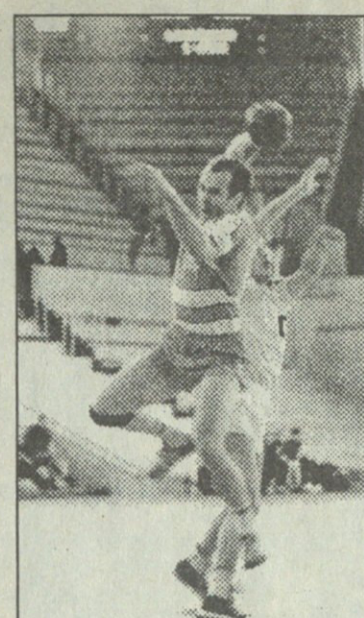
"იბერია" (გორი) 1992-93 - VII

წია თბილისში. მარტო ამიტომ იმსახურებენ სამტრედიელი ხელბურთელები პატივისცემას და მხარდაჭერას, მით უფრო, რომ ისინი თავის ქვეჯგუფში აუტსაიდერები არიან და პრაქტიკულად, წინასწარ წაგებულ თამაშებზე მოდიოდნენ. რაც შეეხება ჩემპიონობის მთავარ კანდიდატებს "შეკარდენს" და "ამირანს", ჯერჯერობით არცერთს არანაირი პრობლემა არ გასჩენია და ქულათა მაქსიმუმით სათავეში სატურნირო ცხრილს. აქვე გაცნობებთ, რომ მეორე ტურში, რომელიც ზეგ დაიწყება სპორტის სასახლეში, რამდენიმე საინტერესო თამაში გველის, რომელთაგანაც უმთავრესია საკვირაოდ დანიშნული "შეკარდენი" - "ამირანის" დერბი.