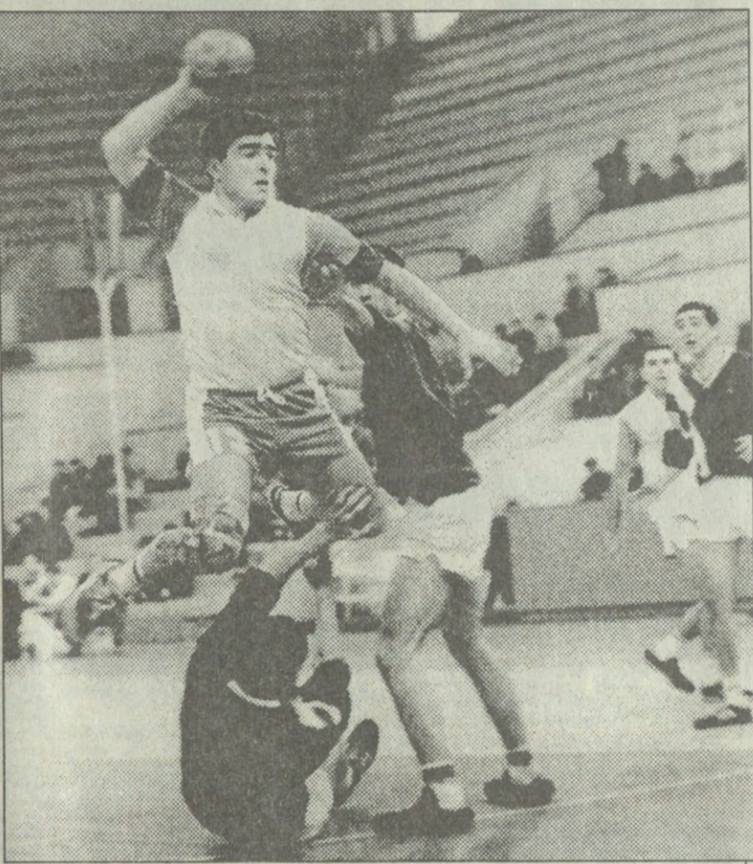
მის ახალბაში ფოტო

ასპარეზობა გაიხსნა წინა პირველობის ვერცხლის პრიზიორის „ამირანისა“ და ჯემალ ცერცვაძის სახელობის ოლიმპიური რესურსის ხელბურთის სპორტსკოლის გუნდის „მართვეს“ შეხვედრით. სამწუხაროდ, დეკემბრის სუსხი უხარამაზარ სპორტის სასახლეშიც ისევე იგრძნობა, როგორც გარეთ. ამის გამო, ყოველდღე ოთხ მატჩზე დასწრება უძნელესი საქმეა. და მაინც, ტურნირი საინტერესოდ მიმდინარეობდა და ცოტაოდენი მაკურეულები კი ესწრებოდა. „ამირანი“ და „მართვე“ განსხვავებული ძალის გუნდებია და ჩემპიონატში მიხვებიც სხვადასხვა აქვთ. „ამირანი“ პირველობისათვის აპირებს ბრძოლას, მართვეები კი უფრო მოკრძალებულ შედეგს უპიზნებენ — ოთხეულში მოხვედრას. თუმცა, ჭაბუკი ხელბურთელების სადღესიად უმთავრესი ამოცანაა სათამაშო პრაქტიკისა და გამოცდილების შექმნა. „მართვეს“,