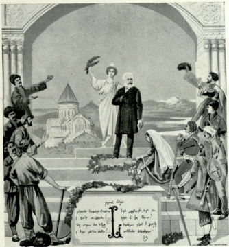
1858 აკაკის იუბილე 1908 • Akakis Jubiläum