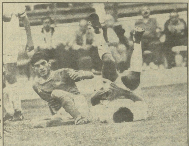
„იბერია“ — „დილა“ 4:1