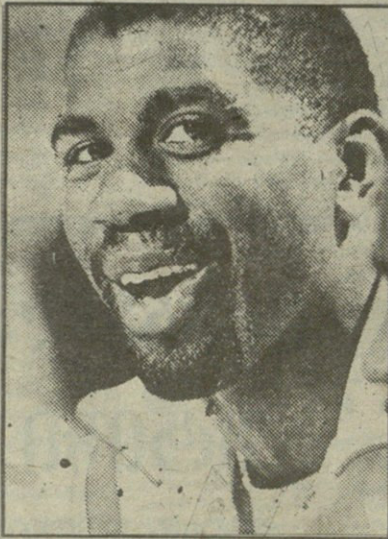
ირვინ „მეჩიუ“ ჯონსონი

ნბა-ს ერთ-ერთი ყველაზე სახელოვანი მოთამაშის ირვინ „მეჩიუ“ ჯონსონის მარტოხელა ცხოვრებას წერტილი დაესვა. ხანგრძლივი ყოყმანის შემდეგ მან დაოჯახება გადაწყვიტა. ირვინმა ცხოვრების შეგზურად სკოლის მეგობარი სიმბატიური ვრლეთ კელი აირჩია, რომელიც მასავით 32 წლის არის. მიუხედავად კალათბურთელის პოპულარობისა და შეძლებისა, კორწილმა ზარ-ზეიმის გარეშე ჩაიარა. ჯვრისწერა შედგა პატარა ქალაქ ლანსინგის ეკლესიაში (ქალაქი ახლოს არის დეტროიტთან) და მხოლოდ 15 წუთს გაგრძელდა. 200-მდე სტუმარს შორის იყვნენ ნბა-ს „ვარსკვლავებიც“. ირვინის და ვრლეთის ცხოვრების ბედნიერი წუთები კი რამდენიმე ათეულმა ჟურნალისტმა აღბეჭდა ფირზე.