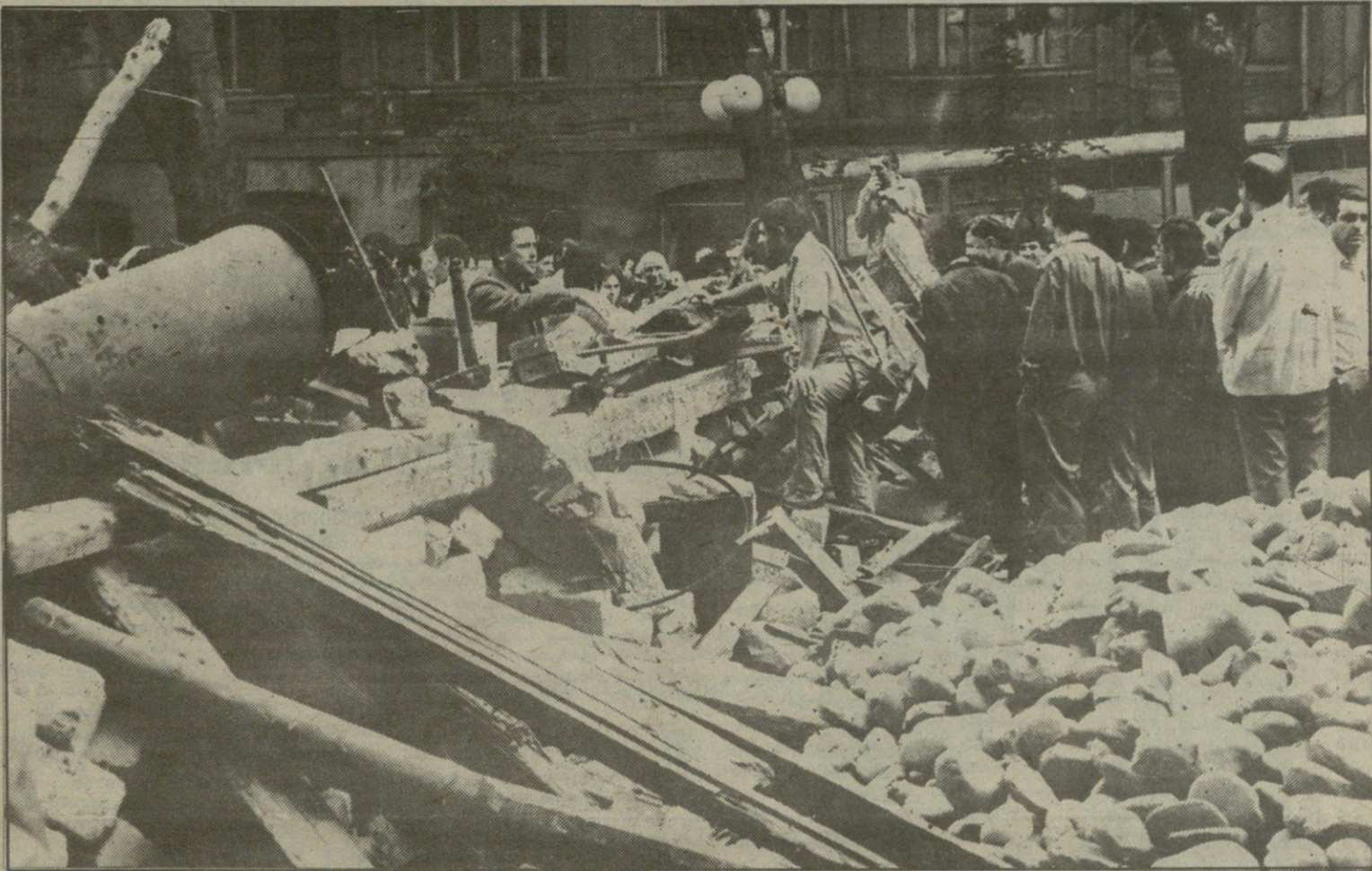
ბარიკადებით ორად გაყოფილი საქართველო... XX საუკუნის მიწურულს... კვამი კვამზე აღმართა მასხვილი... გლოვობს ქართველის დედა. დაკავალდება თითქოს იკლო, ბარიკადებიც აღმართა ჩანს... ღმერთა ინებოს - საპუღამოდ!