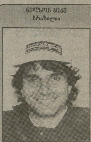
ნელსონ პიკე ბრაზილია