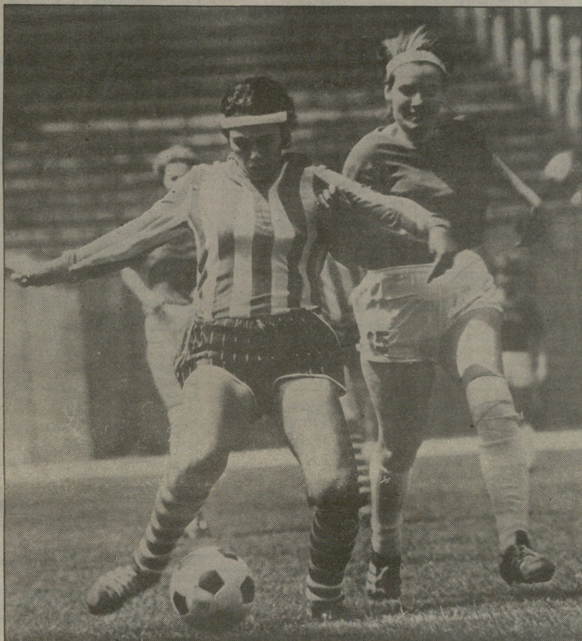
ქალთა ფეხბურთის საქართველოში ამ რამდენიმე წლის წინ მოიკიდა ფეხი, თუმცა ჩვენმა გუნდებმა უკვე არაერთხელ გამოიჩინეს თავი ამ დღეებში თბილისის „მეტეის“ გოგონათა გუნდმა გვასახელა — ზოლანდის საერთაშორისო ტურნირზე მეორე ადგილი დაიკავა (იხ. მე-2 გვ.)