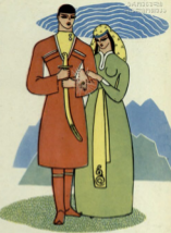
ვაშართა ქარწილი, მაგრამ იმ ქალ წვილი სამი დღე და დამე არ შეწვი- ტოლა შავაღვლეობი...

ისეთი სტენი მოუვყანა, შილ ნახდებზე ბეჭობდა ისეთი პეველი მოტურანი, დღე- საუთი ანათებდა. ვართო დადიის ხმალი მარათა.