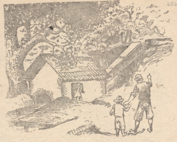
ღ წვერცამეტა ქოსატყუილა ღელავდა მაღლა ნასროლ ზვირთივით! (დასასრული იქნება).

მეტყევეები შეჰყარა დილით, — ურჩევდა წყალში ჩაეშვათ ტივი!