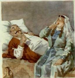
— ვინაა, ის, თუ კვირი დაეცა ხარ, კვირა, ა იმ დღეებზე დასვენე ბუნა ზის?