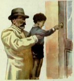
მისი სახელი ჩაბრუნდა მისივე სახელით

თავიდანვე კაცთა სიყვარულის, ძმობას, ერთობას, თავისუფლებას...“