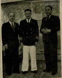
საქართველოს საგარეო საზღვარზე მდებარე ბატონ ილი თავაძეს დათმობენ მონღოლ დამატყუარებელ ქართველებს სახელით მუშაობენ...