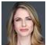
მისალ მიჰელ დიონი გაზეთი „ხალიჯ თაიმს“ 10 აგვისტო 2021

თიანებული საამიროების შეიარაღებული ძალების უმაღლესი მეთაურის მოადგილე მისია გახლავთ, მოსახლეობის 30 პროცენტი უზრუნველყოს ადგილობრივად განთავსებულ საჰაერო წყლის დანადგარებით, ხოლო მოკლე დროში ეს მაჩვენებელი 100 პროცენტამდე გაზარდოს. „ვათერგენის“ (Watergen) უმსხვილეს დანადგარებს დღეში 6000 ლიტრი წყლის გამომუშავება შეუძლიათ და უკვე მუშაობენ აფრიკის სოფლებსა და და ლაზას სექტორის საავადმყოფოებში. წყლის მისაწოდებლად. სუთნლიანი თანამშრომლობის პროექტი „ალ დაჰრა ჰოლდინგთან“ (Al Dahra Holding) ერთად არაბთა გაერთიანებული საამიროების უდაბნოს ეკოსისტემის გათვალისწინებით შემუშავდება.