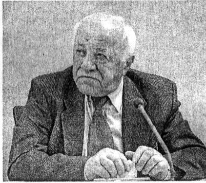
ოცნების წარმომჩენა, რაზეც პიესის სათაურად მიტყვევებს.