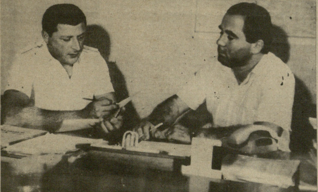
გზის რესპუბლიკაში გართულებული ოპერატიული მდგომარეობა მილიციის თანამშრომლებისაგან მოითხოვს დიდ მოთმინებას, ყველა ქვედანაყოფის გააზრებულ ეროვნული მოქმედებას, როდესაც წინა ხაზზე არიან გამოცდილი და პატიოსანი თანამშრომლები.

— და ბოლოს ბატონო ითარ, ქართველს ერს წინ იმ დიდი გამოცდის ჩაბარება ელის. ეროვნული კონგრესისა და საქართველოს უზენაესი საბჭოს არჩევნები, რომელს უჭერთ მხარს და რატომ? — მე ამ საკითხთან დაკავშირებით საკუთარი პოზიცია მაქვს. იცით, მათ ვინც გადაწყვიტეს ეროვნული კონგრესის არჩევნები (მხედველობაში მაქვს ეროვნული ყრილობა) ჭერაც არ მოუპოვებიათ უსულელობა არაკონკრეტული ერთი სახელით, მით უფრო რომ ის ყრილობა არ იყო სრულიად ქართველი ერის ყრილობა. ხოლო მის უმცირეს წარმომადგენლობას ჩვენ ვერ დავაყისრებთ მეზობარბრის როლს, და ვერც საქართველოს ბედს განდობთ. ამიტომ მე მიმართა, რომ ყოველმა ჩვენთაგანმა, ვინც რეალურად აფანებს მოვლენებს, მხარი უნდა დაუჭიროს უზუნავსი საბჭოს არჩევნებს და მასში ჩვენი საუკეთესო ინტელიგენციის თუ ნებისმიერი ფუნის წარმომადგენლის ალბარგმას ხალხს მობზრდა შპრალი დამარბები, ლოზუნგები, საქირია მრატკიკული საქმე და პრაქტიკული ნაბიჯები, რადგან თავისუფლება თავისით არ მოდის, თავისუფლება უნდა მოვიპოვოთ. ესაუბრა მ. მილიცია.