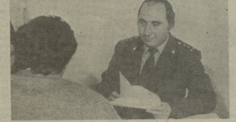
სწრაფად, თანაბრულად თადლითაზრის გოგლო საქმა