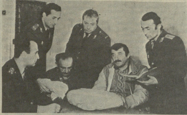
НА СНИМКЕ: оперативная группа, реализатор и изъяты у него наркотики.

Вот так в очередной раз сотрудниками Болнисского РОВД были пресечены действия «наркобизнесменов».