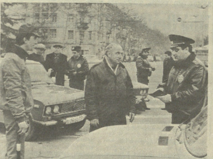
სპეცსახალხო რაზმელები ავტონსპექციის თანამშრომლებთან.