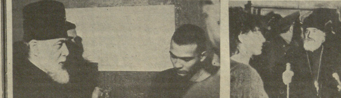
(დასასრული მე-2 გვ-ზე).

იანვარის სუსხიანი დღეა. სიცივე ძვალბოში ატანს. ცივა ამ კედლებშიც, სადაც ათასობით მსჯავრდებული თუ მსჯავრდასადე ბის და უცდის, ელის სამართალს, თავისუფლებას. სიცივე შეკპარვია ბევრი პატიმრის გულს, სულს გაყინვამდეც მისულია, ყინულის ლოდი ადევს ბევრი მთავანის შეგნებას, რწმენას, რა ვადნობს მას, თურა საზოგადოების თანადგომა, ანუ როგორც დღეს ჩვენში ეძახიან ჰუმანურება. ბევრი, ცხოვრებზე ხელჩაქეული აქ იმერთს შინდობა და მის ხატებას ლოცულობს, ბევრისთვის კი უკვე აღარაფერი არსებობს ამ ქვეყნად. ძნელია რწმენადაკარგულ აღმნიანს რაიმე გრძობაზე ელაპარაკო. — იმერთი გწამს შეილო, — ეკითხება საქართველოს კათალიკოს-პატრიარქი ილია II ერთ-ერთ მსჯავრდებულს. — არა მამაო, იმერთი რომ არსებობდეს მე აქ რამინდა მამინ. ქრისტიანობის დღესასწაული ყველა ქრისტიანისთვის პატივმისაგები თარიღია, ვინც არ უნდა იყოს და რა სიტუაციაშიც არ უნდა იმყოფებოდეს. დღეს, როცა გარდაქმნამ და „პერესტროიკამ“ ბევრი სიკეთე მოგვიტანა უკვე მსჯავრდებულსაც მიეცათ შესაძლებლობა კონტაქტი დაამყარონ ეკლესიის მსახურთან. საერთოდ, საერთაშორისო ნორმების გათვალისწინებით ყოველ პატიმარს აქვს უფლება მოითხოვოს ღვთის მსახური აღსარებისთვის, ზიარებისთვის, მონათვლისთვის და სხვადასხვა რიტუალების შესასრულებლად. დღეს შს სამინისტრომ ამ კუთხით უკვე გადადგა გარკვეული ნაბიჯი. თითქმის დამკვიდრდა ყოველ რელიგიურ დღესასწაულზე მსჯავრდებულებთან წმინდა მამების შესვლა. შეხვედრა. აღამიანის დამძიმებულ