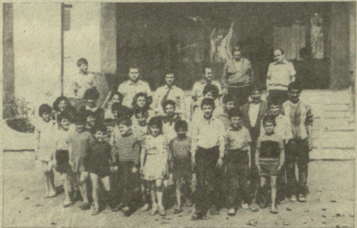
უკვე რამდენიმე წელია ეწეობს საბავშვო სახლის აღსაზრდელებთან მჭიდრო საშუალო მუშაკთა აკავშირებას.