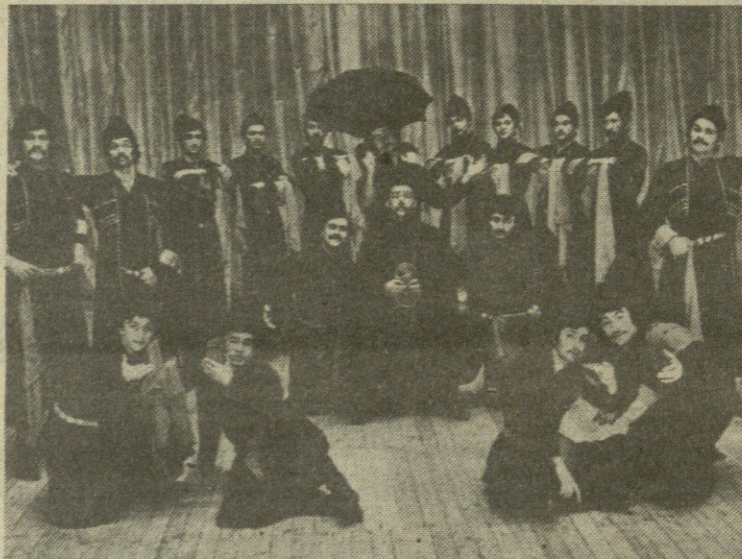
НА СНИМКЕ: выступает ансамбль «Мхедрули».

Ансамбль едет с обновленной программой, в которую входят танцы различных районов Грузии — «Хевсурская баллада», «Лашкрули», «Тбилиური сатрпнала» и др. Гастроли завершаются 18 августа.