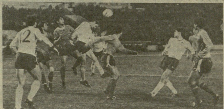
„დინამოს“ სტადიონზე გაიმართა ხსრ კავშირის საფეხბურთო კავშირის თაის მორიგი შეხვედრა თბილისის „დინამოსა“ და დუშანბეს „პამირს“ შორის. ანგარიშით 1:0 გაიმარჯვეს თბილისელებმა.