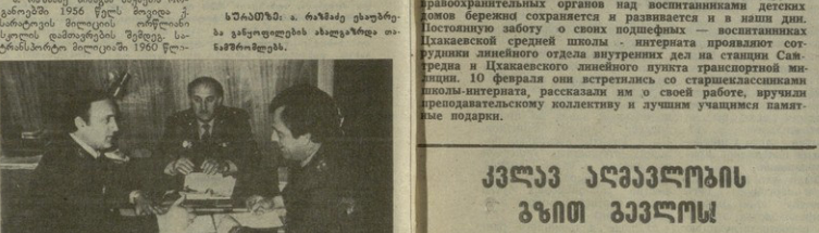
საბრუნებელი მიწის რეკონსტრუქციის უწყვეტი იუბილე — 1974 წელს დაიწყო მისი რეკონსტრუქციის საკითხები.

საბრუნებელი მიწის რეკონსტრუქციის უწყვეტი იუბილე — 1974 წელს დაიწყო მისი რეკონსტრუქციის საკითხები. მიწის რეკონსტრუქციის უწყვეტი იუბილე — 1974 წელს დაიწყო მისი რეკონსტრუქციის საკითხები. მიწის რეკონსტრუქციის უწყვეტი იუბილე — 1974 წელს დაიწყო მისი რეკონსტრუქციის საკითხები.