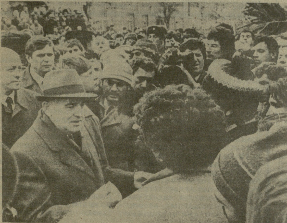
Материалы и репортаж наших специальных корреспондентов из района бедствий читайте на 2-3 стр.

11 ДЕКАБРЯ Генеральный секретарь ЦК КПСС, Председатель Президиума Верховного Совета СССР М. С. Горбачев посетил города Сياتак и Кировакан, пострадавшие от разрушительного землетрясения.