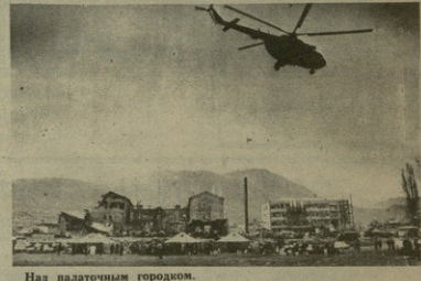
Над палаточным городком.

машину остановили женщины в траурной одежде. Она попросила нас показать ей до села Кумиси.