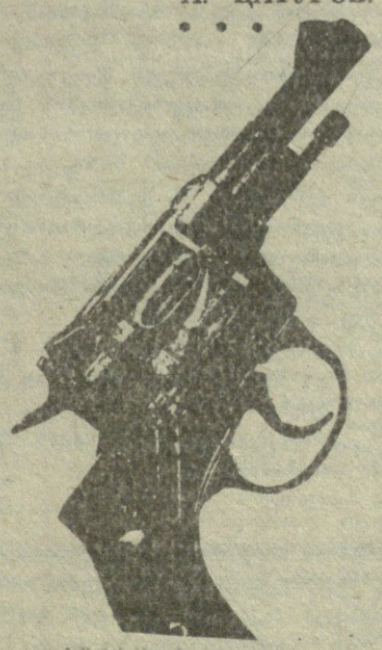
НА СНИМКЕ: изъятое у преступников оружие.

установлены и задержаны. Причем, операция по их задержанию была проведена настолько четко и неожиданно, что ни один из преступников не успел даже оказать сопротивление. У преступников, ранее неоднократно судимых за различные правонарушения, были изъяты маски, холодное и огнестрельное оружие. В ходе следствия выяснилось также, что ими в феврале нынешнего года было совершено в Зестафони еще одно разбойное нападение. Ведущее сейчас следствие должно в ближайшее время выяснить все подробности, в том числе, как возник замысел преступного маскарада, где злоумышленники добыли оружие и другие детали. Мы же отметим оперативность и четкость действий сотрудников уголовного розыска, в короткий срок обезвредивших опасную группу, не давших совершить новым преступлениям. А. ЦАТУРОВ.