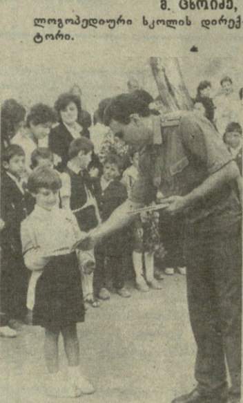
ლოგოპედიური სკოლის დირექტორი.