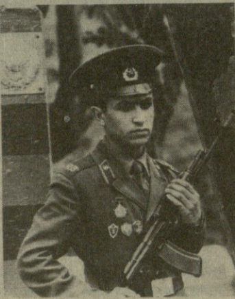
მ. ი. ლენინის ინიციატივით შექმნილი, კომუნისტური პარტიის მიერ აღზრდილი, მტერთან გრავალიცხოვან შერკინებაში გამორბოთბილი საბჭოთა სასაზღვრო ჯარები დღესაც ასრულებენ სამშობლოს წმიდათაწმინდა საზღვრების დაცვის პასუხსავებ ამოცანას.

КОМАНДУЮЩЕМУ КРАСНОЗНАМЕННЫМ ЗАКАВКАЗСКИМ ПОГРАНИЧНЫМ ОКРУГОМ КГБ СССР генерал-майору ПЕТРОВАСУ ЯКОВУ КИРИЛЛОВИЧУ НАЧАЛЬНИКУ ПОЛИТИЧЕСКОГО ОТДЕЛА полковнику ШКУРУКУ МИХАИЛУ ЯКОВЛЕВИЧУ