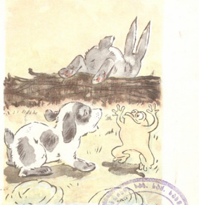
ნახატები ი. გაბაშვილისა

გამარჯვებული მეგობრები იცინოდნენ და ხელიხელ ჩაკიდებული ხტოდნენ.