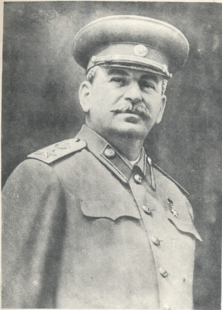
Թոնցծ Զեհաճոմենիս-ժց ՆԺճընի