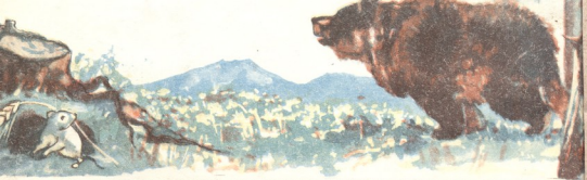
ყდის მხატვრობა გუთონის რ. სტურლას.

ასე სძლებენ ზამთარში დათვები, მარეები, ლამურები და სხვა ცხოველები, რომელთაც მთელს ზამთარს სძინაეთ; მათ ქონი ჰკვებათ და ათბობთ კიდევ.