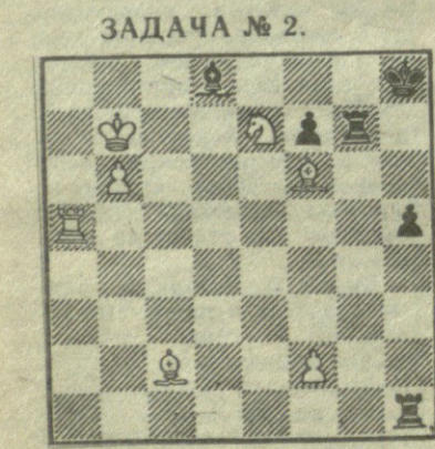
Белые начинают и дают мат в четыре хода.

Вопрос № 2. Когда была создана Международная шахматная организация? Сколько лет советская шахматная организация входит в ФИДЕ?