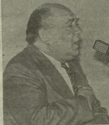
НА СНИМКЕ: народный артист СССР Е. Леонов.

На днях в Доме культуры им. Ф. Э. Дзержинского состоялись творческие встречи с артистами Московского театра им. Ленинского комсомола. В гостях у сотрудников органов внутренних дел были народный артист РСФСР О. Янковский и заслуженный артист РСФСР А. Абдулов. Эта творческая встреча запомнилась непосредственной искренностью общения артистов со зрителями, готовностью честно ответить на все вопросы, поделиться мыслями о переменах, происходящих в масштабе страны, о перестройке работы театральных коллективов. Много интересного принесла и встреча со всеми любимым народным артистом СССР Е. Леоновым и заслуженным артистом РСФСР А. Збруевым, которые ответили на многочисленные вопросы зрителей, подарили им радость общения с настоящим искусством.