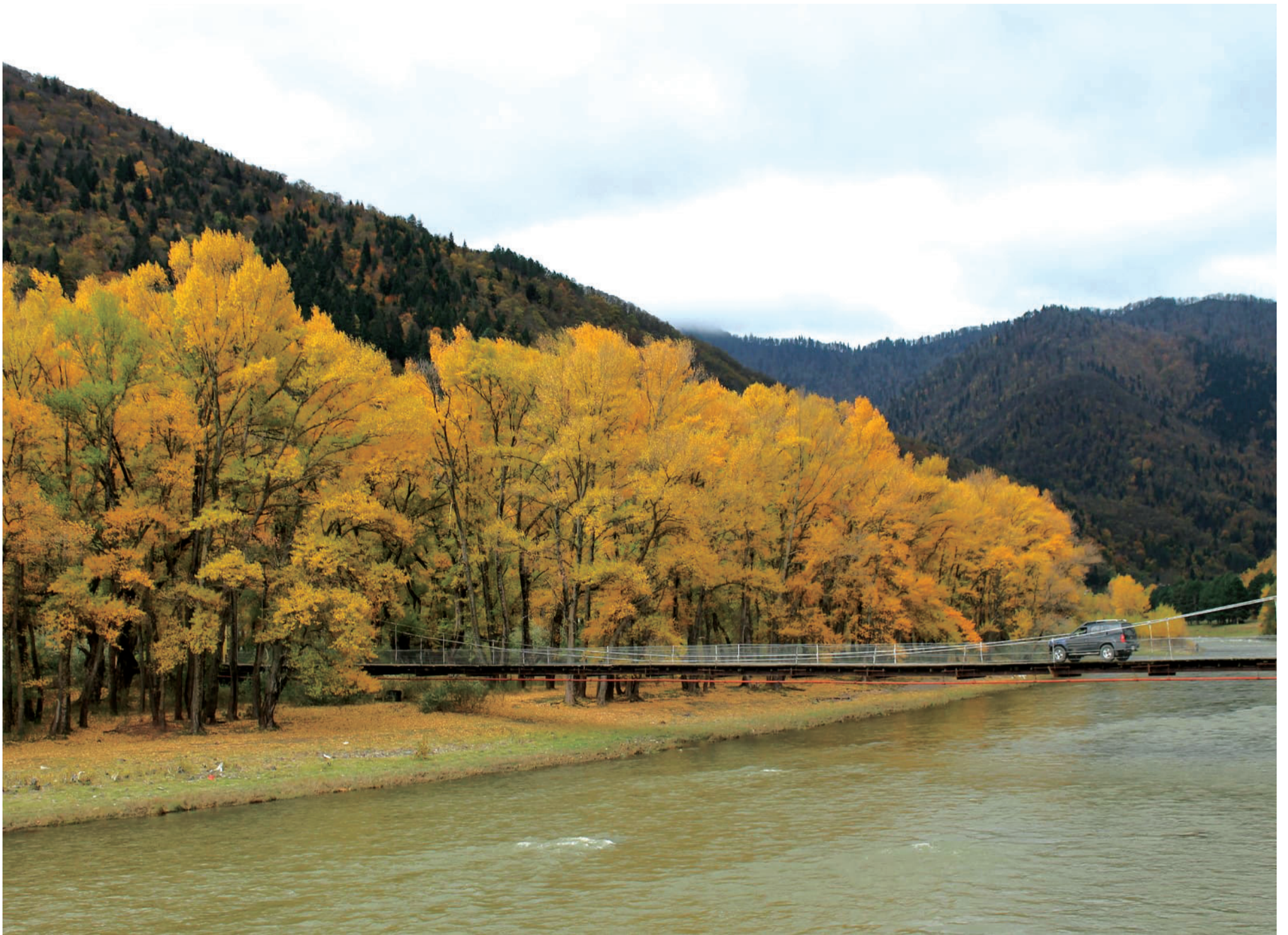
ოქროსფერი შემოდგომა ხაშურის მუნიციპალიტეტში. სოფელ სათივის ხიდი მდინარე მტკვარზე.