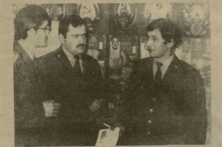
Встреча выпускников со слушателями состоялась недавно на Тбилисском факультете Московской высшей школы милиции МВД СССР. На всех кафедрах шел заинтересованный и полезный разговор выпускников с преподавательским составом школы. В этот день школу посетили и руководители горрайорганов внутренних дел, раз-