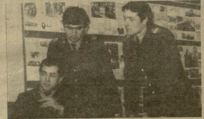
Заметно сократилось число правонарушений, хулиганства и других преступных проявлений на почве пьянства.