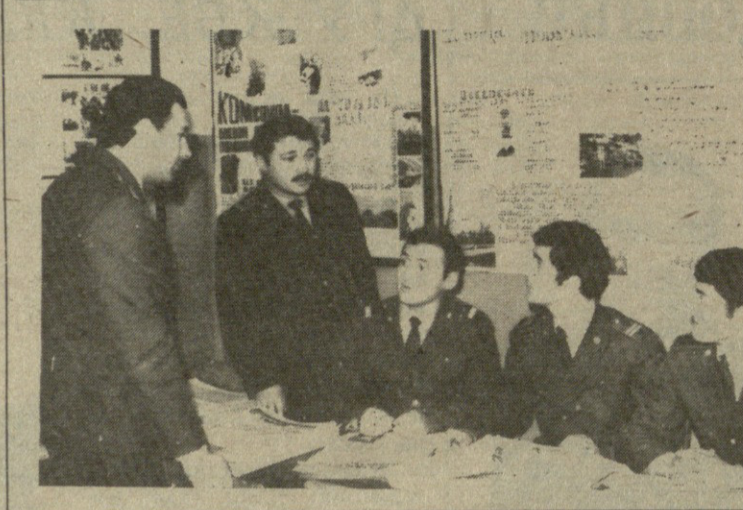
С большим вниманием и интересом изучают предсезонские документы молодые сотрудники ППС. В эти дни их часто можно встретить в Ленинской комнате подразделения.

Тем не менее, мы полностью отдаем себе отчет в том, что в борьбе с преступностью еще много неиспользованных резервов. Коммунисты, весь личный состав отдела преисполнены решимости сделать все от них зависящее, чтобы XXVII съезд партии встретить достойно. Д. ГАБЕЛИЯ, заместитель начальника Гальского РОВД по политчасти, капитан милиции.