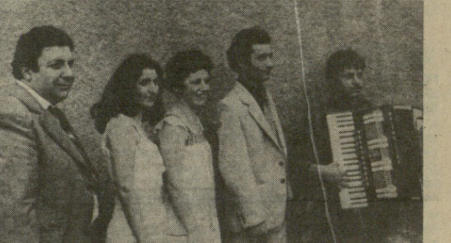
НА СНИМКЕ: агитбригада УПО МВД ГССР «Садгейсо».