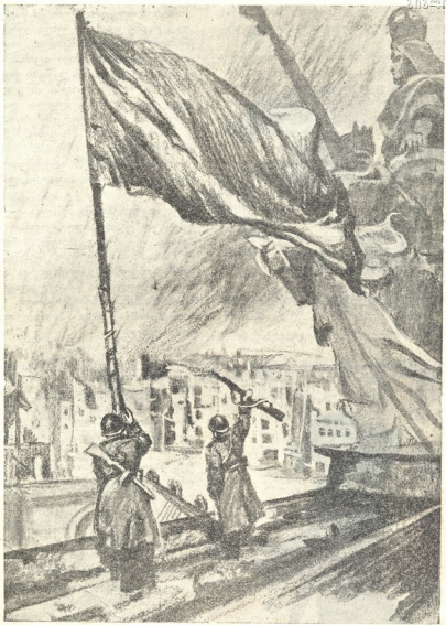
ღრღის ალმარტვა ბერღინში, რაიხსტაგზე საბჭოთა მებრძოღების მიერ, 1945 წლის მაისში.

სტალინური პრემიის ლაურეატის, სახალხო მხატვრის უჩა ჯაფარიძის ნახატი